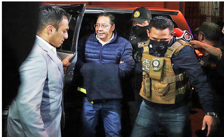
El lawfare daña gravemente la credibilidad de las instituciones bolivianas

El Gobierno de la República Bolivariana de Venezuela, emitió ayer un comunicado oficial, en el cual manifestó su preocupación ante la detención del expresidente del Estado Plurinacional de Bolivia, Luis Arce, hecho que califica como lawfare (uso estratégi-