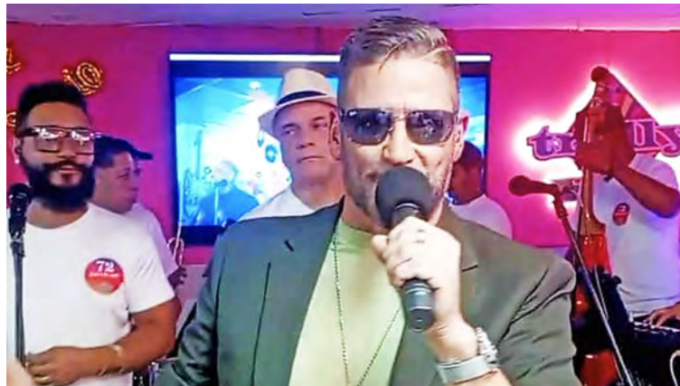
Barrios mantiene su potente voz y canta en España y otras naciones europeas

Este lanzamiento marca la “reconquista” de su época do-