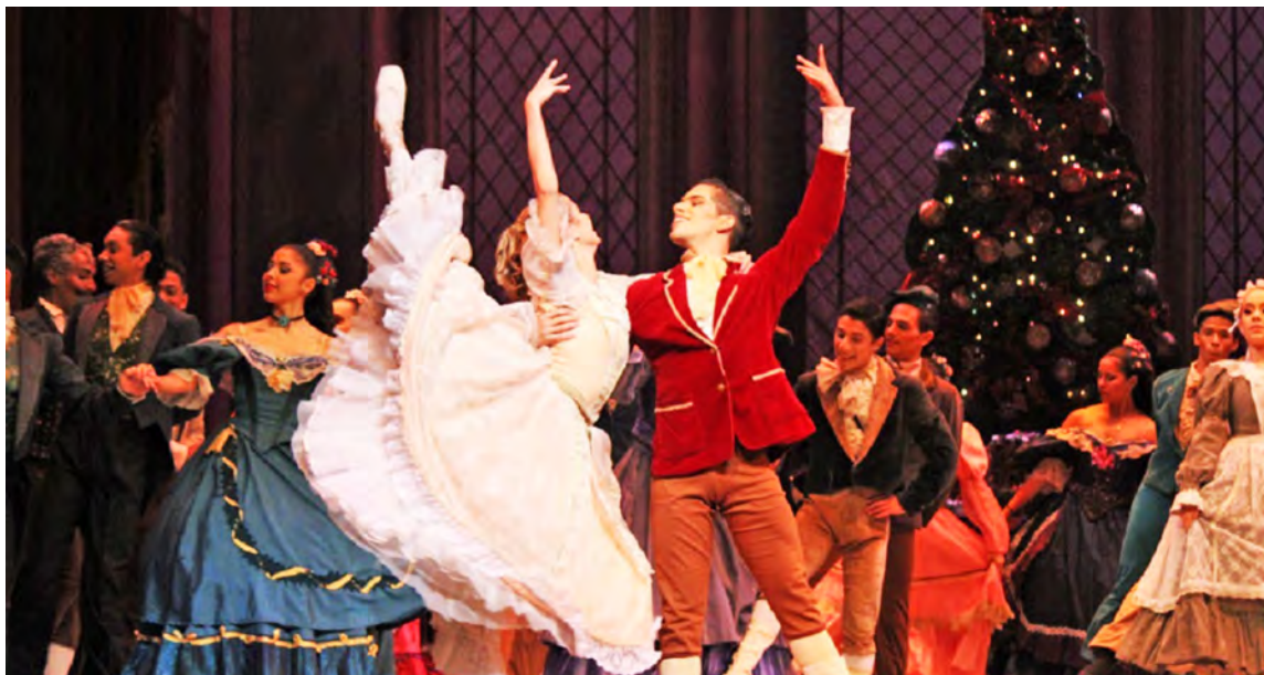
Todos los años El Cascanueces del TTC siempre trae sorpresas

Aparte de los bailarines destacan la escenografía y el vestuario