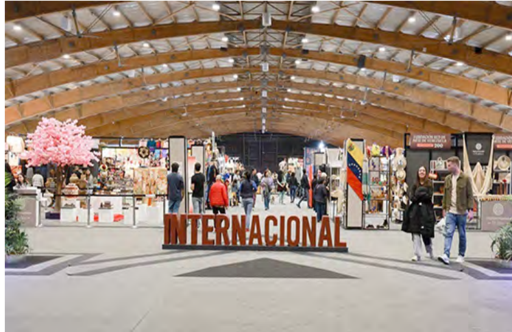
El sector ha tenido una muy positiva temporada este 2025.

Una muestra de 27 artesanos venezolanos, incluidos en el catálogo “Hecho en Venezuela a mano”, representa a nuestro país en la exhibición de Expoartesanías 2025 en Bogotá, Colombia.