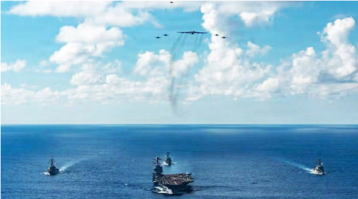
Fuerzas Armadas de EE.UU. operan en el Caribe; el país mantiene portaaviones cerca de la costa venezolana

A pesar de la postura defensiva de Venezuela y de los pedidos de paz hechos por el Gobierno de Nicolás Maduro, la falsa equivalencia persiste en los artículos periodísticos y análisis.