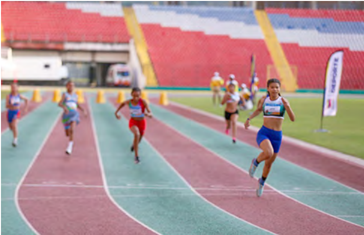
El paratletismo tiene muchos practicantes y seguidores

Monagas se alzó con las pesas y reinó con seis oros. Miranda y Lara se mantienen en primer y segundo lugar respectivamente en el cuadro de medallas, Caracas ascendió al tercer lugar