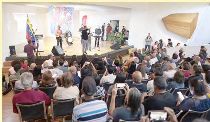
Anunciaron que el evento tendrá segunda edición en el 2026.