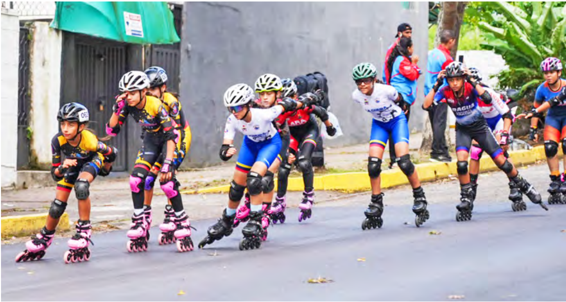
Las tachirenses son una potencia en patinaje de velocidad

Entretanto, en los 4 kilómetros eliminación femenino, la