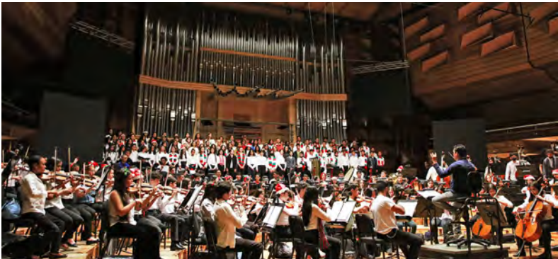
El repertorio abarca la amplia variedad de géneros decembrinos venezolanos