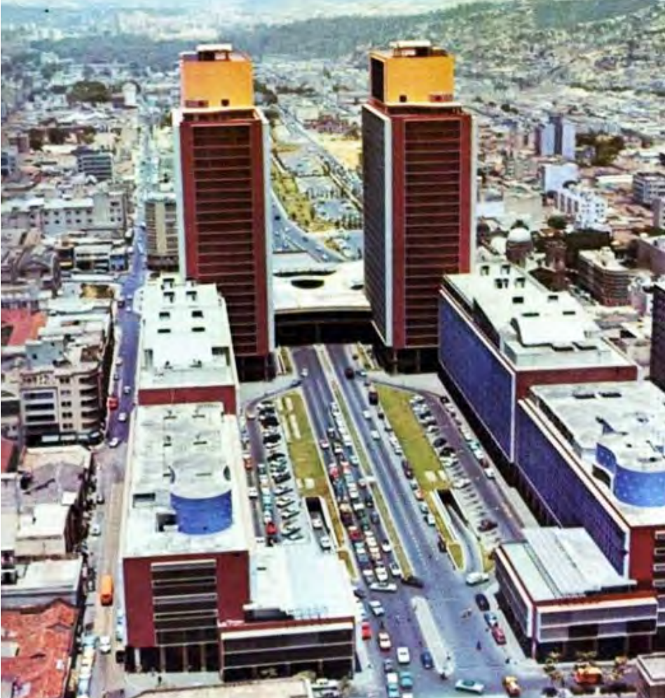
Torres del Centro Simón Bolívar

“Quería señalar”, dice, “que posterior al derrocamiento de Medina, cuando se promulgó la Constitución de 1947, que abrió las libertades públicas y amplió los derechos sociales, eso trajo un dardo envenenado como que fue la eliminación de la inmunidad jurisdiccional del Estado venezolano, presente en todas las constituciones desde 1891. Todos los litigios que involucraban al Estado venezolanos debían ventilarse en tribunales venezolanos obligatoriamente. Cualquier sentencia extranjera era nula. A partir de 1947 la Constitución tiene la coletilla que dice “con excepción de aquellos que por su naturaleza deban ventilarse en tribunales extranjeros”. Esa coletilla la mantiene la constitución de 1999. Yo quiero aprovechar la oportunidad para proponer que en la Reforma Constitucional que se va a discutir el año que viene se corrija esa situación que viene desde el derrocamiento de Medina Angarita”.