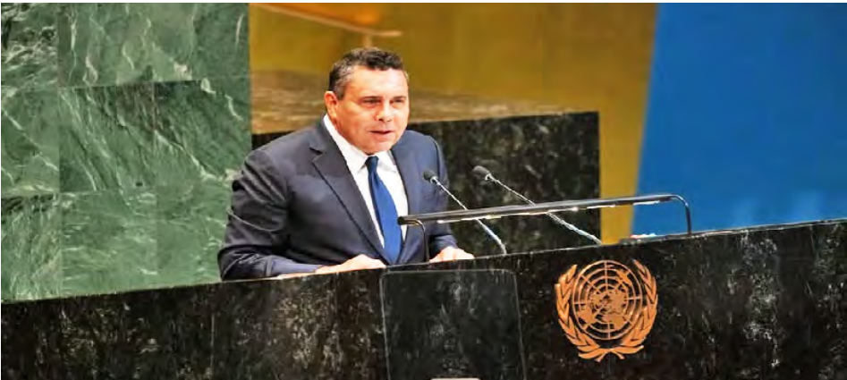
El flagelo del colonialismo está vivo “y debe ser derrotado para proteger a todos los pueblos del mundo”, dijo Samuel Moncada

El embajador de Venezuela ante la Organización de las Naciones Unidas (ONU), Samuel Moncada, denunció ayer ante una sesión de la Asamblea General, las amenazas colonialistas de Estados Unidos, tras la confesión del presidente Donald Trump de que busca apropiarse de los recursos naturales de la nación bolivariana. Al respecto, destacó que la República Bolivariana de Venezuela defenderá su soberanía, integridad territorial, independencia en todos los campos necesarios con el fin de mantener la paz y la seguridad de la nación. Indicó Moncada que Trump “pretende regresar el reloj de la historia 200 años para imponer una colonia en Venezuela” y que “no existe un documento jurídico que quede en pie frente