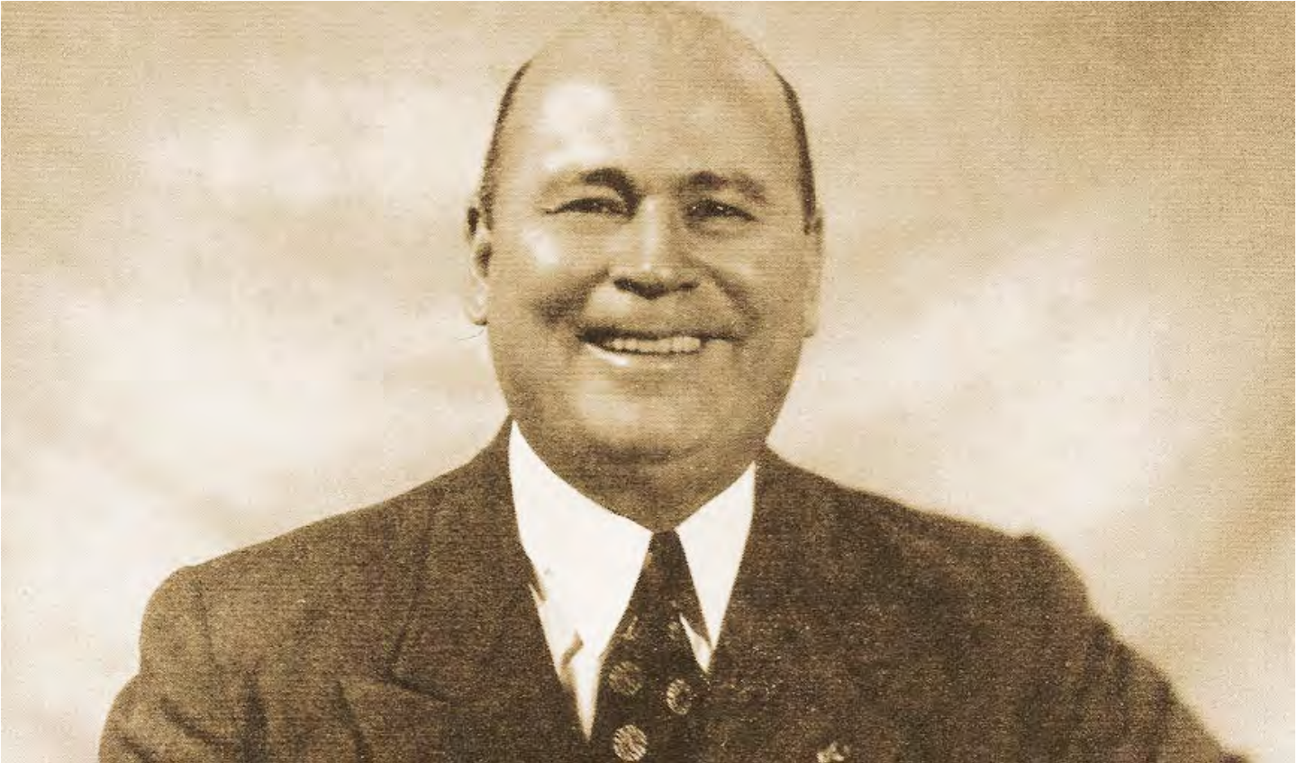
Isaías Medina Angarita, a la derecha

“Desde el año 2000”, señala Marcos Fuenmayor, la Asamblea Nacional aprobó mediante acuerdo, como lo establece la Constitución, la inhumación de los restos de Isaías Medina Angarita en el Panteón Nacional. En ese momento nosotros laborábamos en el Archivo Histórico de Miraflores y recibimos una solicitud de la AN para elaborar un informe que respaldara la propuesta. La moción fue votada favorablemente por todas las fracciones políticas con excepción de AD, que se abstuvo. El acuerdo fue publicado en la Gaceta Oficial, de manera que solo falta un paso para ejecutarlo, que es el decreto del Ejecutivo Nacional. Desconozco las razones por la cual no se ejecutó al momento. Hubo un rumor de que los familiares de Medina se opo-