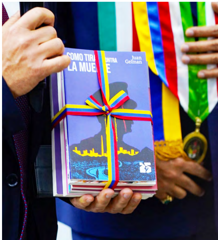
Los primeros ejemplares se entregaron en la Librería del Sur

Entre los primeros títulos disponibles se cuentan Viento de Primavera , de Alaíde Foppa;