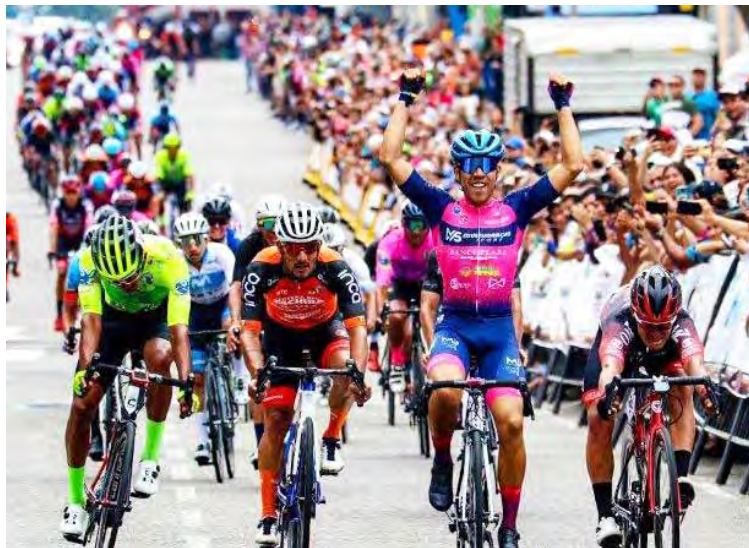
La Vuelta al Táchira cumplirá seis décadas de historia

La sexta etapa, el 14 de enero desde El Vigía a La Grita, 170 kilómetros. Séptima 15 de ene-