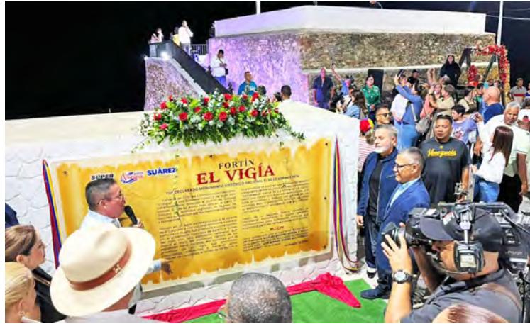
El monumento sirve como atractivo turístico y como elemento para enseñar nuestra historia

El Fortín El Vigía, un símbolo del paisaje cultural del estado La Guaira, fue oficialmente rehabilitado y reintegrado al patrimonio accesible del país. Los trabajos de restauración, ejecutados por el Gobierno nacional, en conjunto con la alcaldía del municipio Vargas, culminaron con un acto inaugural el pasado fin de semana.