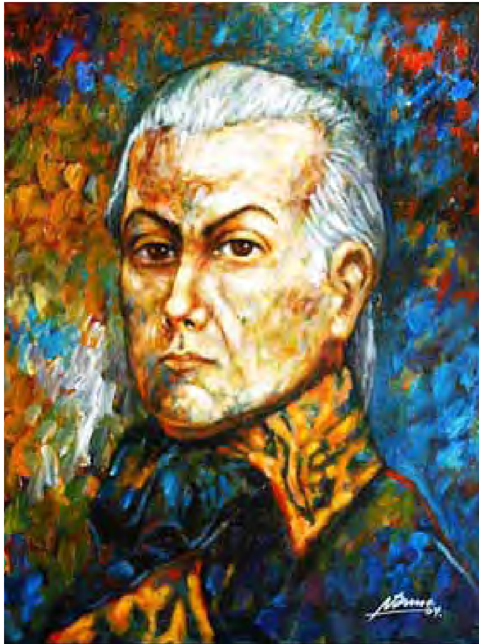
Miranda. Autor: Nicasio Duno. Coro, Estado Falcón 2004. Acrílico sobre tela, 45 x 40 cm Disponibile en: http://www.franciscodemiranda.org/iconografia

No obstante, para el momento en que se hace esta reunión independentista en Francia, Olavide había cambiado de opinión. Si bien había apoyado con entusiasmo la Revolución Francesa en sus comienzos, terminó siendo otra víctima del período del Terror. Llevado a prisión y sus bienes confiscados, al ser liberado a la caída y muerte de Robespierre, se retractará de sus ideas revolucionarias y se reconciliará con la Corona española. Esta situación, sin embargo, no es aludida en el acta de