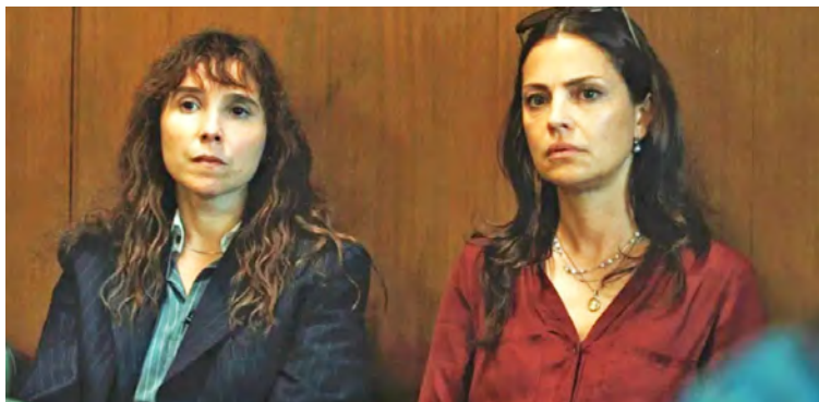
El filme argentino ha contribuido a un debate sobre dignidad y derechos humanos en una escala global

T/ Prensa Latina