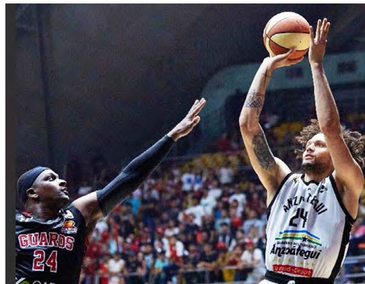
El básquet criollo no se duerme

Otra de las decisiones que arrojó la reunión de representantes de los equipos que componen el circuito, fue la de mantener en cuatro la cuota de jugadores importados inscritos por encuentro y solo tres de ellos pueden permanecer en cancha simultáneamente. Asimismo, se ratificó la decisión