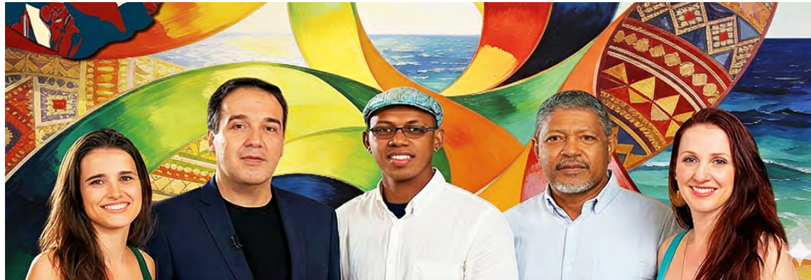
Los encuentros se realizan cada día a las 6:00 p. m.

La edición número seis del Encuentro Virtual de Escritores Lusófonos, un espacio dedicado a la promoción de la lengua y la literatura en portugués, se celebra en nuestro país desde ayer, 26 de diciembre, y hasta el próximo lunes 30, gracias al esfuerzo en conjunto entre la Coordinación para la Enseñanza del Portugués en Venezuela (CEPE Venezuela) y la Embajada de Portugal en Caracas, en colaboración con el Festival Fli-