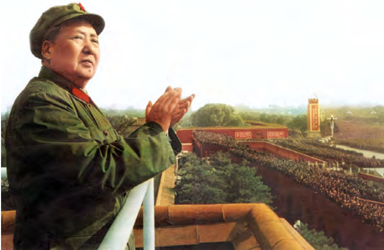
Señala el comunicado que Mao Zedong forjó la historia de una nueva etapa de emancipación y avances de toda la sociedad china

El Gobierno Bolivariano de Venezuela emitió un comunicado oficial con