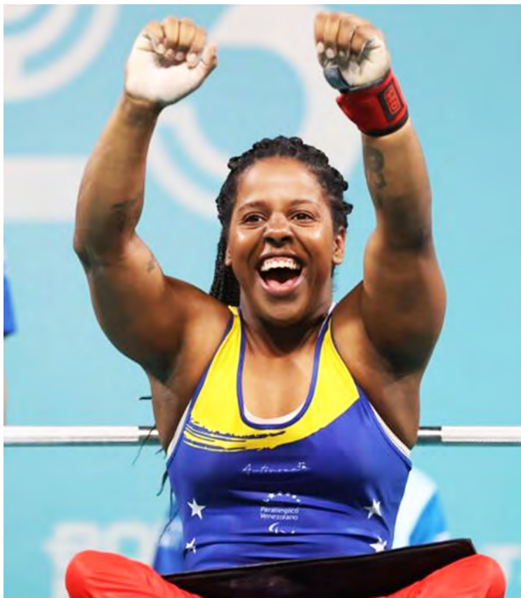
Los paratletas brillaron en varias disciplinas

En deportes colectivos, la selección nacional de voleibol