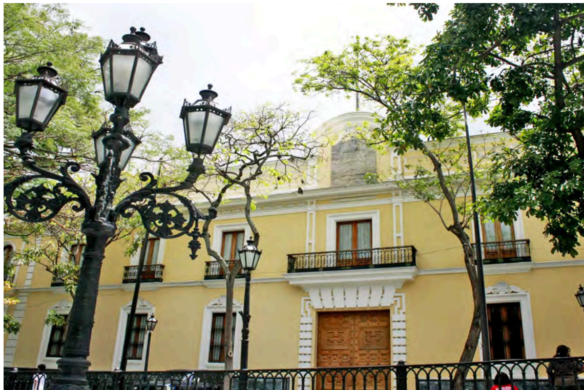
La situación que afronta Somalia solo puede lograrse respetando su soberanía

El documento divulgado por el ministro del Poder Popular para Relaciones Exteriores, Yván Gil, en su canal de Telegram, enfatiza que el país se adhiere y apoya las resoluciones