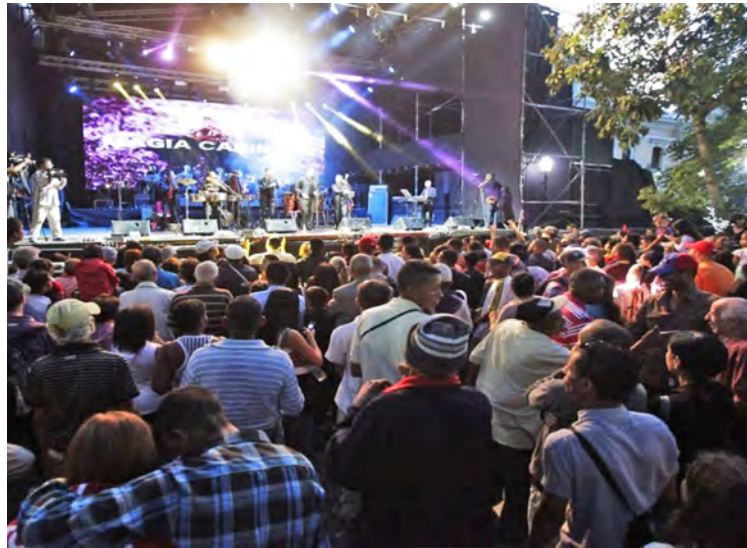
El cartel dominical es de primera