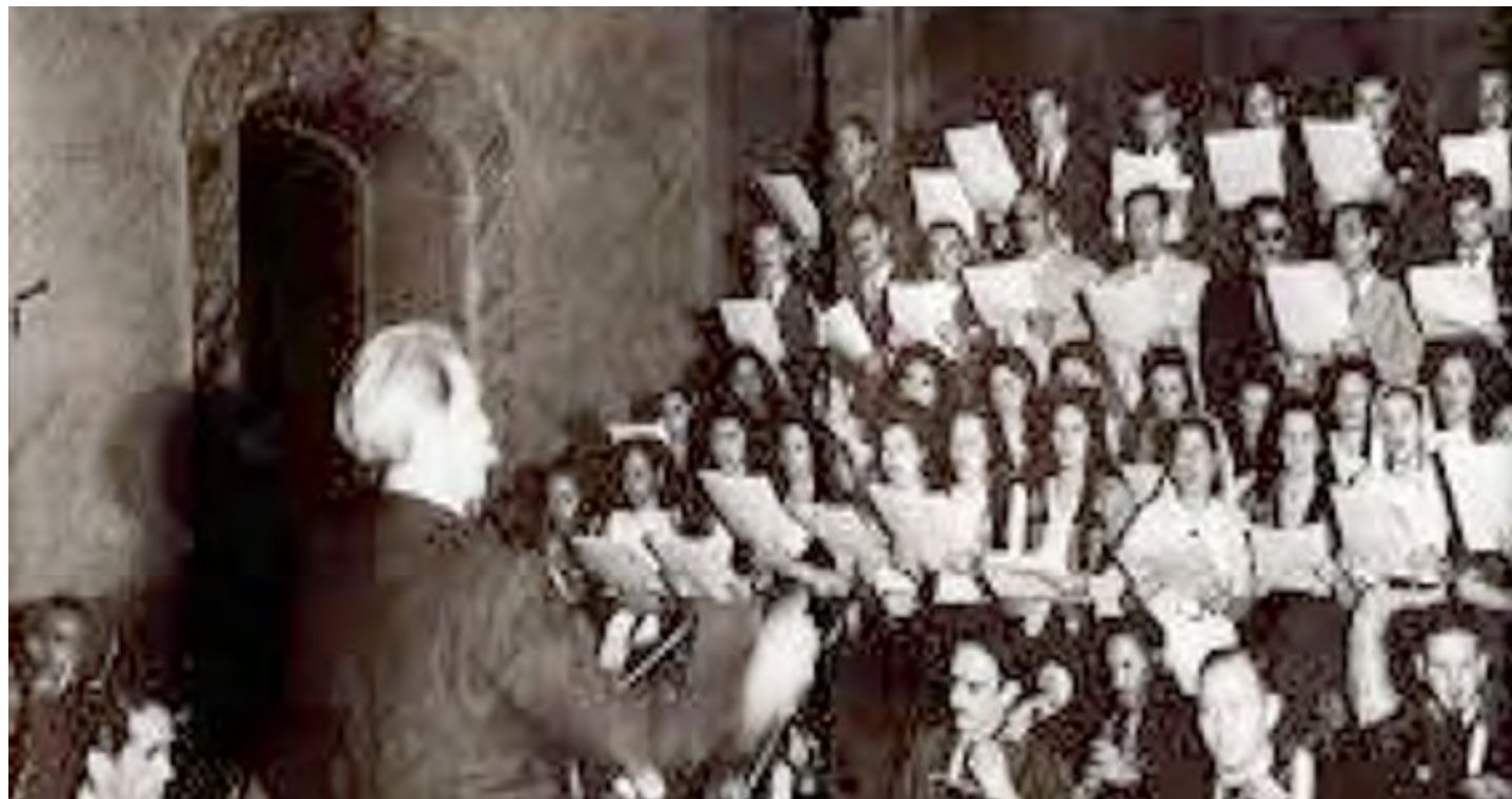
El maestro Vicente Emilio Sojo dirige el Orfeón Lamas