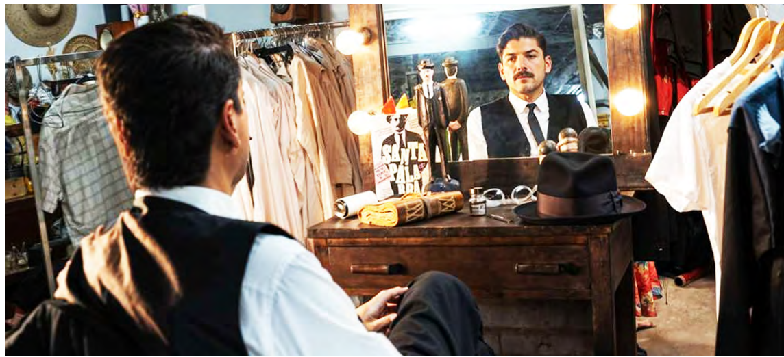
El 70 por ciento de la narración se basa en hechos documentados

Después de la canonización de José Gregorio Hernández, su vida y legado llegan a las tablas caraqueñas con el coreodrama José Gregorio Hernández, la historia , pieza que se presenta desde el pasado 26 de diciembre con la intención de ofrecer una visión contemporánea y simbólica del llamado “Médico de los Pobres”, por medio de una propuesta escénica que combina actuación,