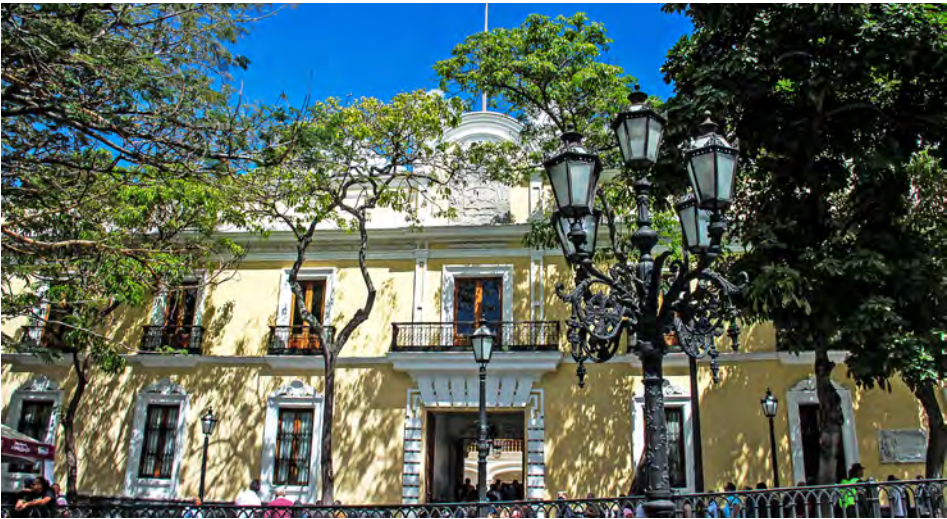
“Es una violación flagrante de los compromisos internacionales asumidos por Washington”, señala parte del comunicado

La República Bolivariana de Venezuela, emitió un comunicado en el que expresa su firme y categórico rechazo al anuncio del Gobierno de los Estados Unidos (EE.UU.) de vender armas a gran escala a Taiwán, por considerar que esta acción unilateral constituye una grave injerencia a los asuntos internos de China y una violación flagrante de los compromisos internacionales asumidos por Washington.