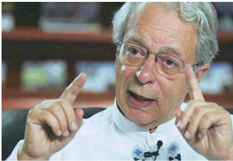
El intelectual enumeró un prontuario de derrocamientos por parte de EE.UU. a lo largo de la historia

En declaraciones exclusivas a Prensa Latina, el fraile dominico condenó el hecho perpetrado la víspera y añadió que se trata