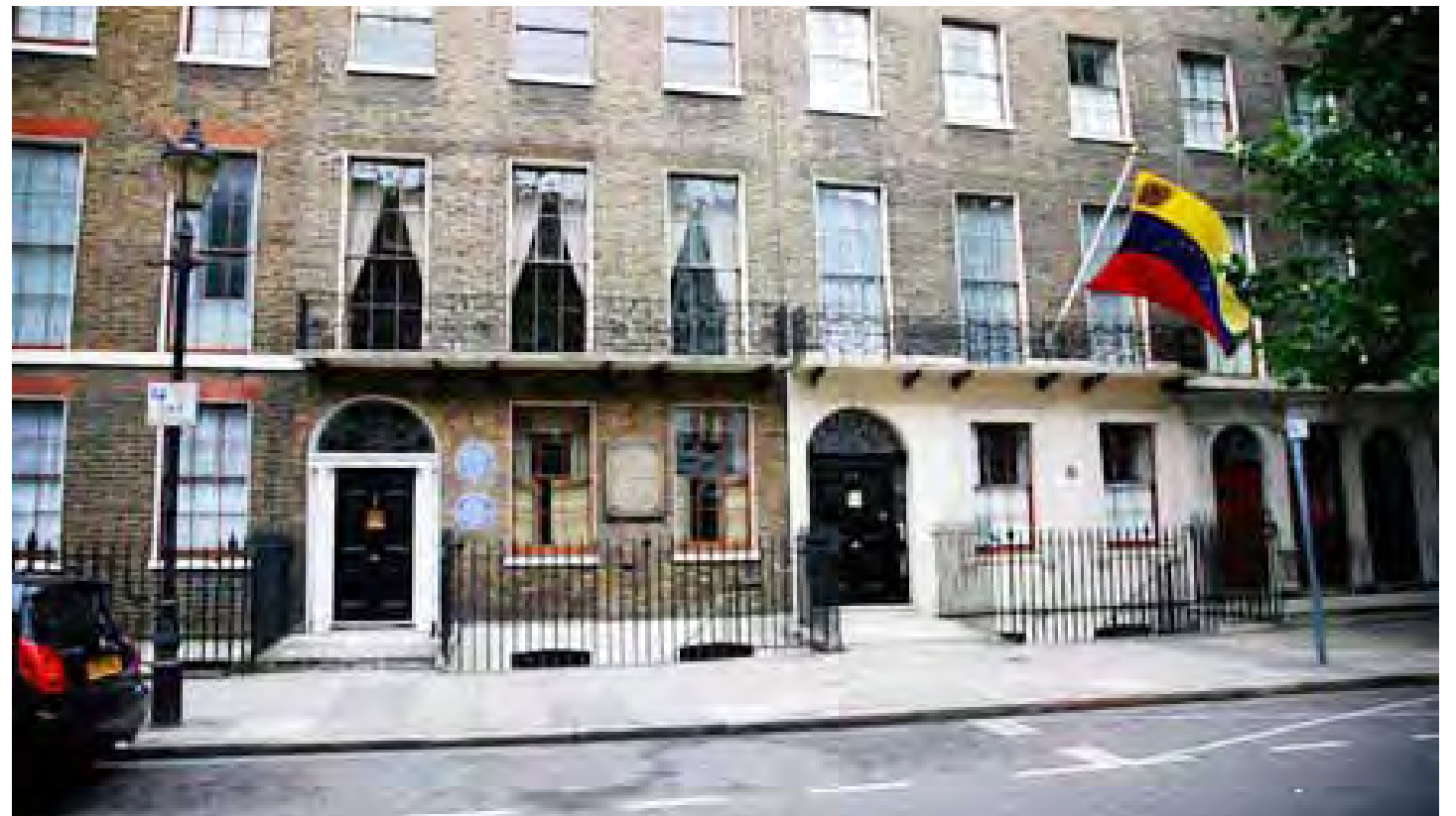
Casa de Miranda en Londres. Hoy: 58, Grafton Way, Fitzrovia, Londres. (A la derecha, Consulado de Venezuela en Reino Unido).

No hay aquí mención de que Sara Andrews sea la madre de Leandro y mucho menos la hay, de que para ese momento ya ella estaba esperando, aunque no lo supieran, al segundo hijo de Miranda; quien nacerá el 27 de febrero del siguiente año (ya Miranda en las costas de Haití, terminando de armar su Expedición Libertadora) y será llamado Francisco. Ambos niños habrían nacido en esa casa alquilada por Miranda a mediados de 1802; probable-