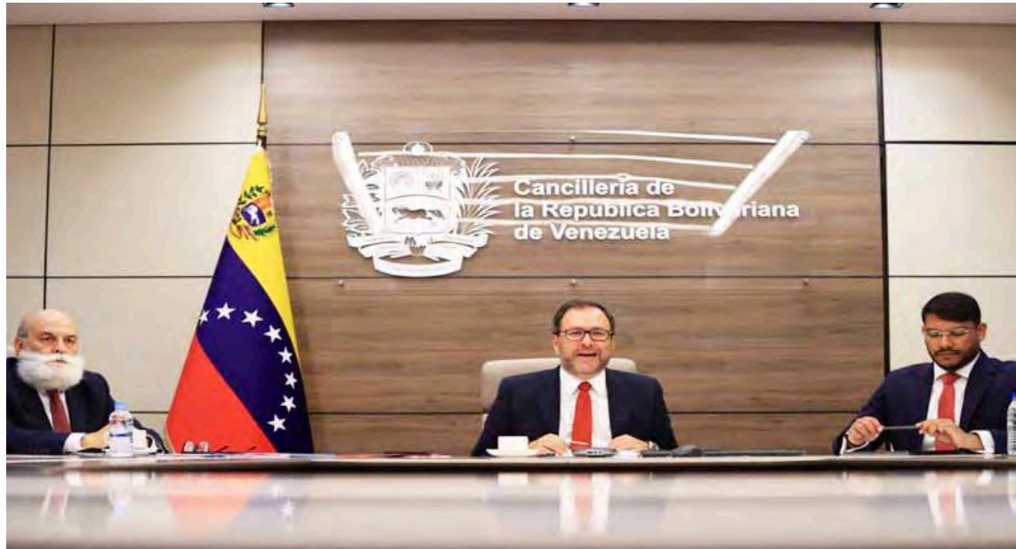
“El ataque no es solo contra Venezuela; sino contra América Latina y el Caribe”, dijo el canciller Yván Gil

Denunció el diplomático que el gobierno de Trump “violó de manera abierta y deliberada la Zona de Paz de América Latina y el Caribe, proclamada en el año 2024, la Carta de las Naciones Unidas, los derechos humanos