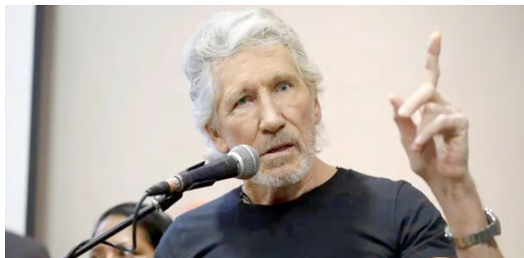
El músico siempre ha sido admirador de la Revolución Bolivariana

T/ Redacción CO - Agencias F/ Archivo CO Caracas