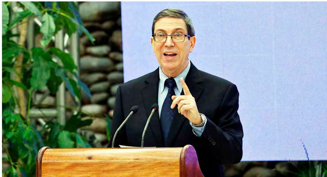
“El ataque a Venezuela es una amenaza para todas las naciones de América Latina y el Caribe”, denunció Bruno Rodríguez

fundamentales y la inmunidad personal de un Mandatario Nacional en funciones”.