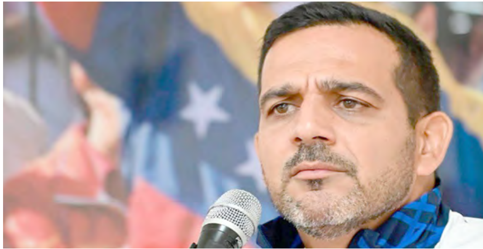
“Es el momento de probar de lo que estamos hechos”, indicó el gobernador José Alejandro Terán

“Hemos despertado (el sábado en la madrugada) con esta inaceptable incursión del imperialismo yankee en este suelo sagrado, algo que no se veía desde hace aproximadamente 124 años. Nues-