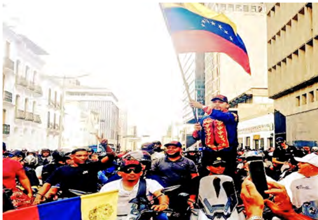
La publicación ofrece una crónica en tiempo real

Más allá de un simple compendio de poemas, el boletín se erige como una creación cultural colectiva de resistencia y duelo, un espacio en el