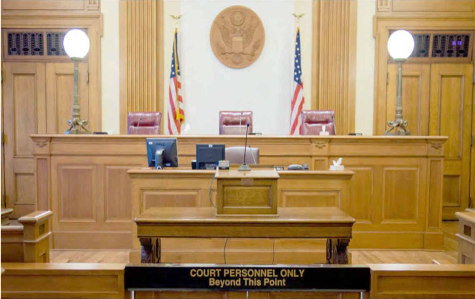
Lo que cambia ahora es el punto de ebullición, es el momento en que se abandona la ficción de la legalidad y se recurre abiertamente a la fuerza

La noción de “ataque a gran escala”, empleada por Trump en su mensaje del 3