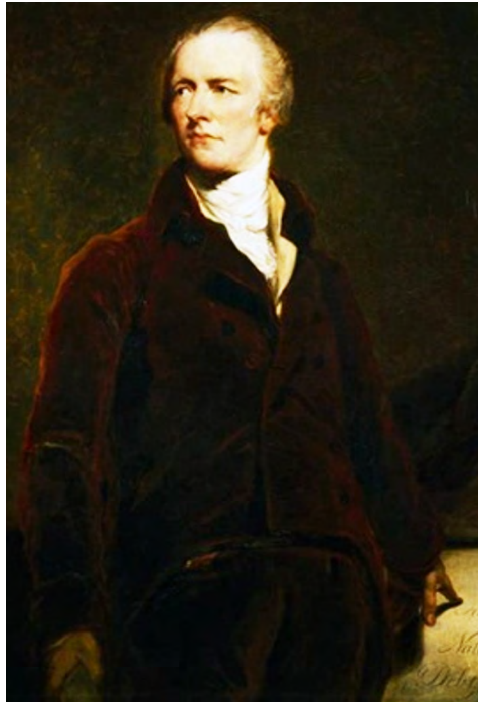
Retrato de William Pitt, el Joven. Copia de George Peter Alexander Healy, a partir del original de Sir Thomas Lawrence. Palacio de Versalles.

El 14 febrero de 1783 es propuesto por primera vez para integrar el dueto que presidirá el Parlamento, pero es derrotado. Pasa unos meses en Francia. Regresa en octubre y se reincorpora al Parlamento, justo cuando se está discutiendo un proyecto de ley sobre la administración de la Compañía de las Indias Orientales; compañía que había alcanzado un inmenso poder económico y de casi total