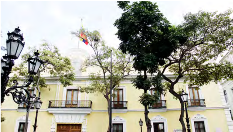
El Gobierno reitera que el diálogo es la única vía para resolver controversias

La relación entre la República Bolivariana de Venezuela con el Caribe y la República de Cuba se ha cimentado históricamente en la hermandad, la solidaridad, la cooperación y la complementariedad.