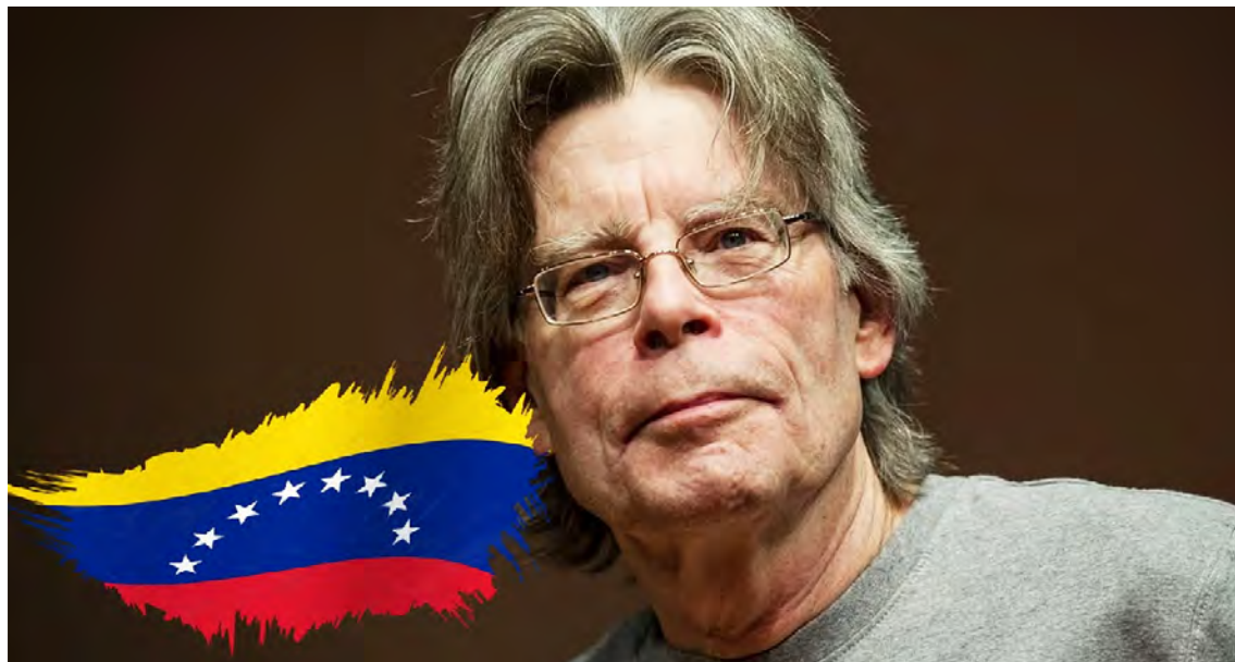
King señala que “el mundo es un lugar que da miedo”

King acusó al republicano de hipocresía y de motivaciones ocultas centradas en el petróleo venezolano, en lugar de la lucha contra el narcotráfico alegada por la Casa Blanca. Esta