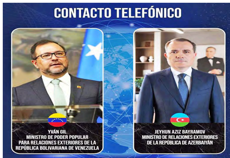
El diálogo entre Yván Gil y Jeyhun Bayramov se centró en el rechazo al ataque militar injustificado de EE.UU.