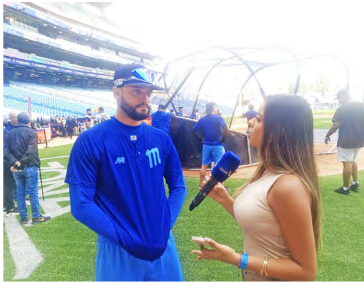
Logró doce holds y marca de 3-0 en 35 encuentros

Fue el importado que más lanzó en la ronda regular, pero no se queja para nada: “Es que en realidad, cuando tú vas a un país de refuerzo, siempre