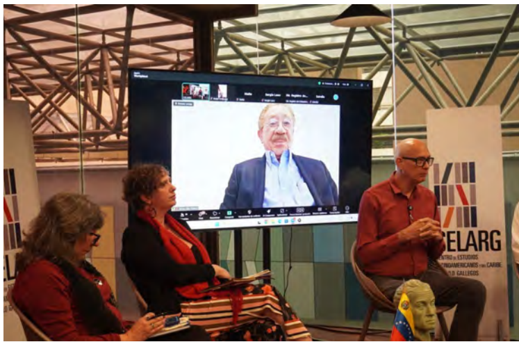
Estimaron que la subjetividad política en Venezuela es un escenario de batalla