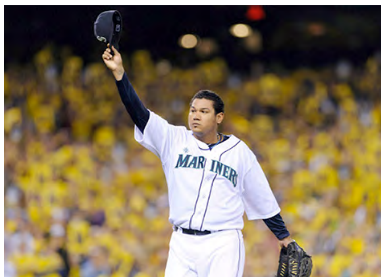
Hernández tuvo números resaltantes en quince campañas.

Sin embargo, en este 2026 ya suma 92 sufragios públicos y, como se dijo, treinta de los