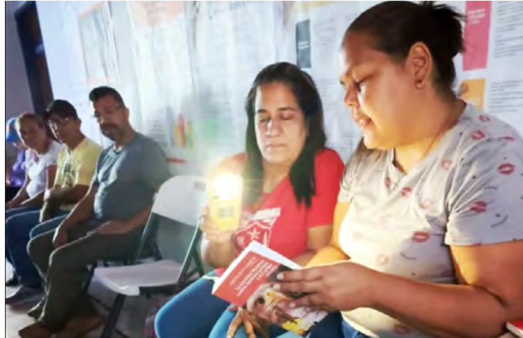
La alcaldía del municipio Cristóbal Rojas también apoyó la actividad

Integrantes de los consejos comunales y la comunidad organizada se sumaron a estos círculos de lectura con el objetivo de analizar y debatir dos obras fundamentales que contextualizan la realidad geopolítica actual: La Doctrina Monroe contra América Latina y el Caribe (1823-2023) y La Batalla de Ayacucho , editados por Monte Ávila Editores Latinoamericana y El Perro y la Rana, respectivamente, ambas por