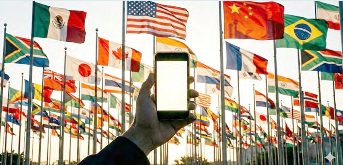
En el tiempo de la inteligencia artificial, urge una nueva alfabetización político-virtual para la digestión del caos y la ansiedad, del vacío y los vacíos.

Sin alfabetización, afirmó Lenin, quedamos excluidos de la política y somos pasto de “rumores, chismes, cuentos de hadas y prejuicios”.