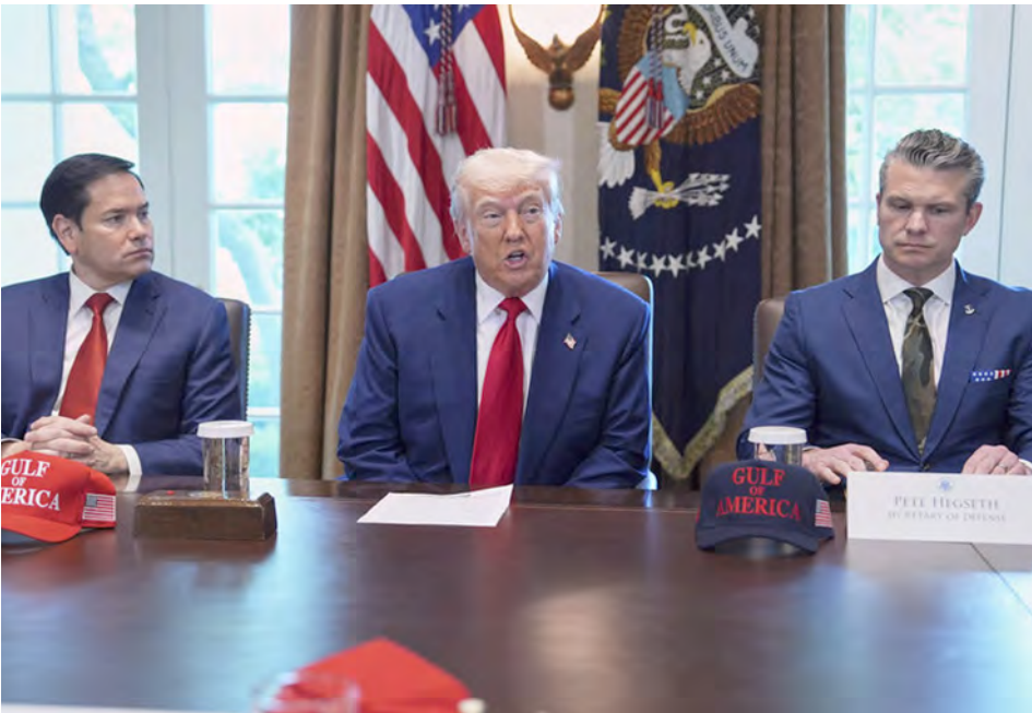
El secretario de Estado, Marco Rubio, y el secretario de Defensa, Pete Hegseth, junto al presidente Donald Trump.

También importa la dimensión emocional. Helicópteros, explosiones, apagones y el traslado forzoso de un jefe de Estado no son hechos “neutros”. Ese tipo de shock colectivo se gestiona —y se explota— con categorías simples y agresivas: “narco”, “terrorista”, “parásito”, “amenaza”. La deshumanización reduce la complejidad y hace tolerable la violencia material.