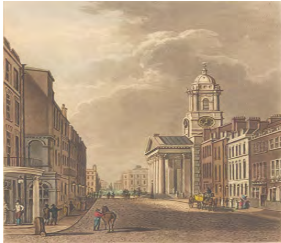
Calle St George. Autor : John Papworth, 1816. Tomado de : Ackermann's Repository of Arts.

El lenguaje utilizado en estas misivas es un radical lenguaje de ruptura definitiva con España y, al mismo tiempo, de afirmación de una nueva entidad: el Continente Colombiano o Colombia . El problema radicaba en que ese su lenguaje, resultaba extraño para la mayoría de los criollos. Incluso el nombre de Continente Colombiano era totalmente novedoso para la mayoría de ellos y, por tanto, con poca o ninguna significación; o, como en