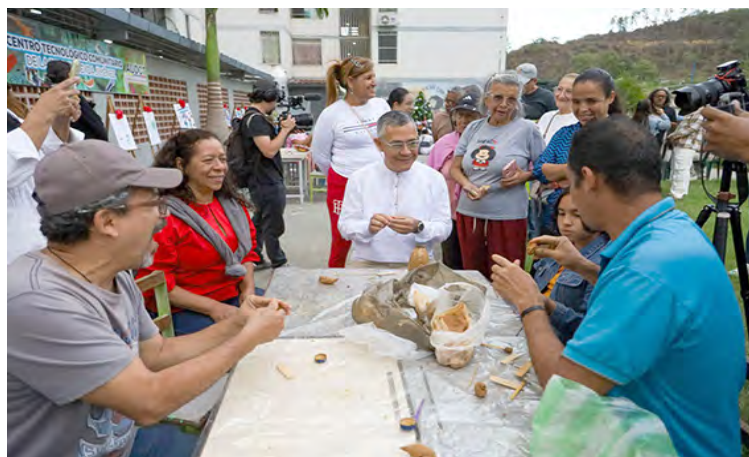
Eventos similares se repetirán sucesivamente los fines de semana

El pasado fin de semana, bajo el lema “Nuestra cultura es la paz”, la Gran Misión Viva Venezuela Mi Patria Querida desarrolló una jornada cultural en el Complejo Urbanístico Ezequiel