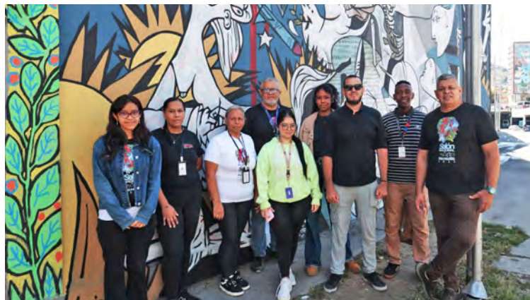
Se espera que elaboren piezas similares en los próximos meses

D urante un acto especial celebrado en las afueras de la Galería de Arte Nacional (GAN), en Caracas, se inauguró un mural colectivo que reinterpreta la icónica obra del Pablo Picasso, Guernica , y las obras pictóricas de Elsa Morales, concebido como una expresión artística en denuncia de los bombar-