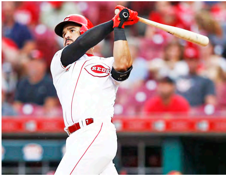
Con Cincinnati brilló por siete campañas (2015-2021)

El jugador estrella transferido en la fecha límite de cambios de 2025, Suárez, demostró que aún puede conectar jonrones a raudales. El toletero tercera base terminó con 49 jonrones, igualando su mejor marca personal, y registró una línea ofensiva de .228/.298/.526 (OPS de .824). Treinta y seis de esos jonrones llegaron en tan solo 106