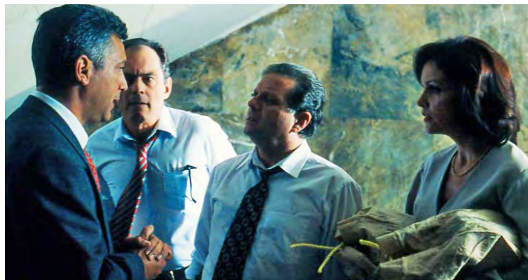
La exhibición combina clásicos con títulos contemporáneos

La cartelera está diseñada como un tributo a las figuras históricas y contemporáneas de la industria nacional e incluye homenajes a directores icónicos como Román Chalbaud, Luis Alberto Lamata, Solveig Hoogesteijn, Alberto Arvelo y Jacobo Penzo, al tiempo que incorpora el trabajo de realizadores de generaciones más recientes. La muestra se proyectará de forma simultánea en las salas capitalinas del Museo de Bellas Artes (MBA), el Centro de Estudios Latinoa-