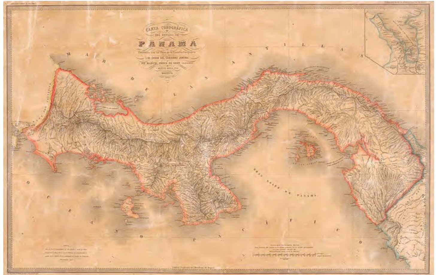
Carta Corográfica del Estado de Panamá. Autores: Manuel Ponce de León y Manuel María Paz. Tomado del "Atlas de los Estados Unidos de Colombia, antigua Nueva Granada", 1865. Archivo de Wikimedia Commons

Entre las muchas obras publicadas a ese respecto, destacó la escrita por Arthur Dobbs, de origen irlandés, titulada: Un resumen de todos los descubrimientos que se han publicado de las islas y países adyacentes al gran océano occidental entre América, India y China, etc., señalando las ventajas que se pueden obtener si se encuentra un paso corto a través del estrecho de Hudson hasta ese océano. (1744) . Si bien esta obra plantea la construcción de un paso entre ambos océanos muy al norte de Canadá, lo cual lo hacía tan poco atractivo como el paso por el estrecho de Magallanes al sur del Río de la Plata, su éxito se debió a que puso en evidencia la necesaria y urgente conexión que debía establecerse entre el Atlántico y el Pacífico, a fin de asegurar la superación de la grave crisis provocada por una revolución industrial que exigía no sólo una vía segura sino más rápida, para la salida de la producción de las nuevas mercancías. Salida que para la Europa no española resultaba ilusorio plantearla atravesando territorios ajenos; como lo eran las posesiones de la corona borbónica en el Caribe; a menos