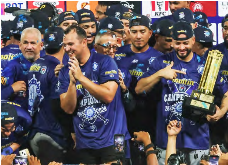
Magallanes buscará un nuevo cetro para su histórica vitrina