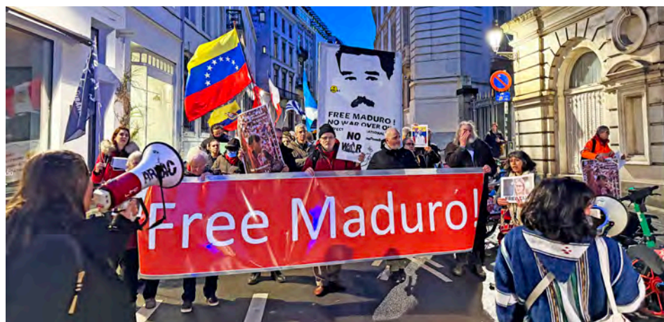
Grupos de solidaridad lamentan “la ausencia casi total de acción” del Gobierno belga ante el secuestro de Maduro y Flores

T/ Redacción CO-Mppre