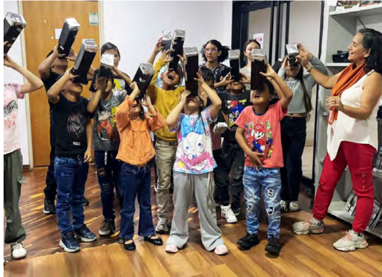
Este año esperan consolidar la oferta formativa con nuevas propuestas

De acuerdo con Ugueto, el año 2025 fue de muy alta actividad formativa y de difusión. Según los datos, la institución realizó 230 talleres de formación fotográfica que beneficiaron a 5.705 personas, y 15 cursos especializados para 450 participantes. Además, se llevaron a cabo 40 eventos fotográficos con 1.639