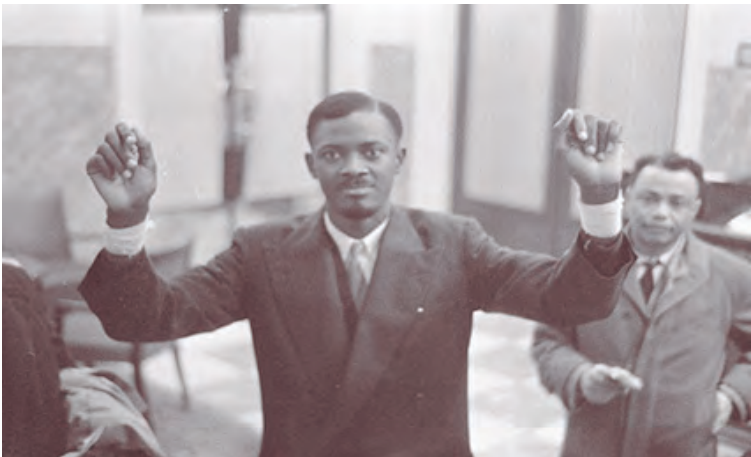
Patrice Émery Lumumba, líder anticolonialista y nacionalista congoleño

Setenta años después del asesinato del líder africano, la agresión contra Venezuela no es una réplica mimética. Es la repetición estratégica de ese patrón, adaptada a las tecnologías y tácticas del siglo XXI. Ya no se trata solo de fracturar un territorio con una secesión clásica. Se busca atacar la multidimensionalidad del cuerpo soberano en una operación sincrónica