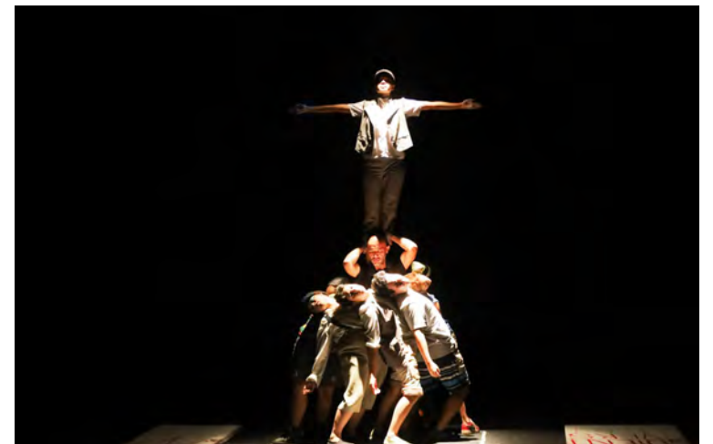
Participan integrantes de los elencos Emergente y de Laboratorio

La obra cuenta con la asistencia de dirección de Gema Nerissa, producción de Jason Hernández, asistencia de producción de Sofía Carreño, iluminación de Alejandro