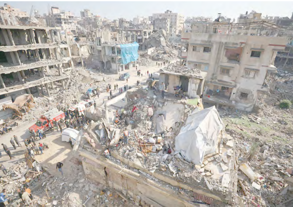
Una vista aérea del edificio en el vecindario de Nasr, en la Franja de Gaza. 16 de diciembre de 2025

El ataque institucional directo contra una funcionaria de derechos humanos de la ONU por hacer su trabajo revela hasta qué punto se intentan silenciar las pruebas del sufrimiento del pueblo