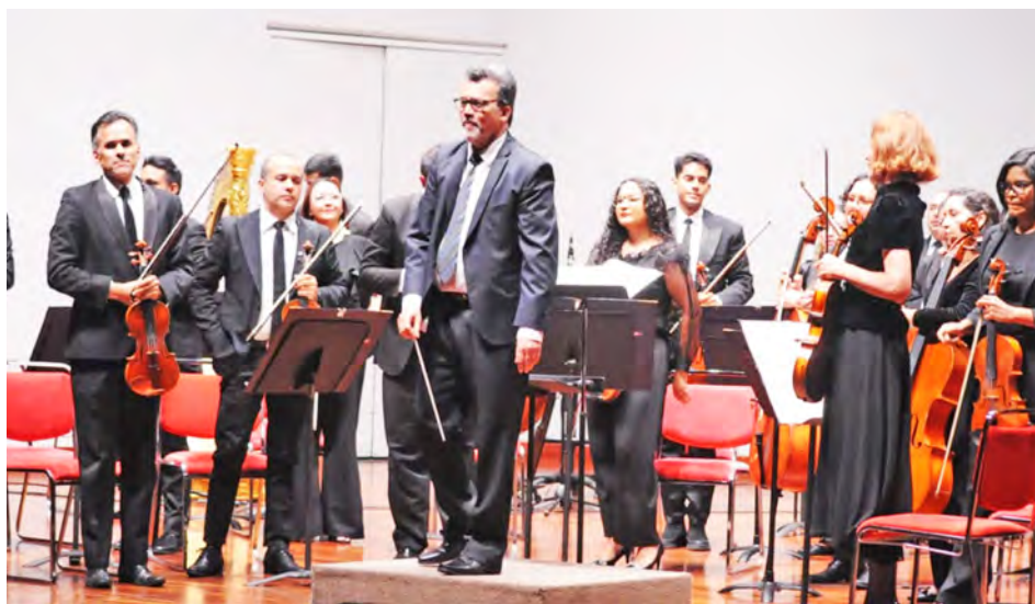
La nueva temporada será “el preámbulo de una celebración histórica”

El concierto inaugural titulado “Pasión Sinfónica”, se llevará a cabo el