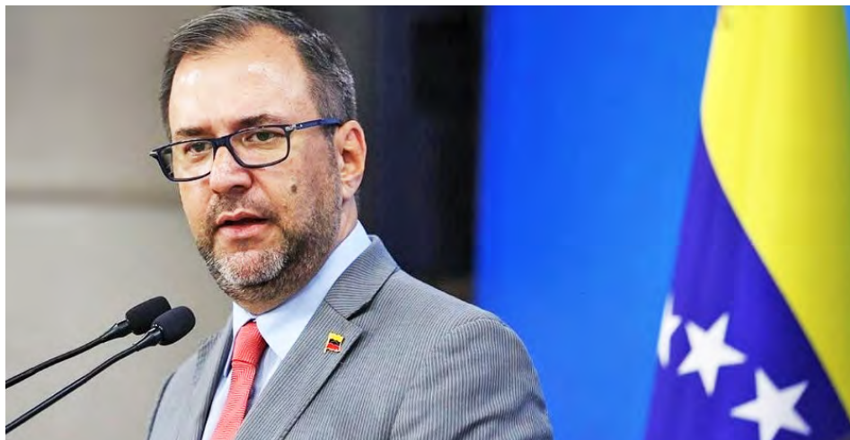
Ministro Iván Gil defendió la soberanía venezolana

“Es contradictorio el hecho de que un gobierno producto de un golpe de Estado contra el presidente Pedro Castillo, y de un proceso posterior manchado por la ilegitimidad”, pretenda opinar sobre