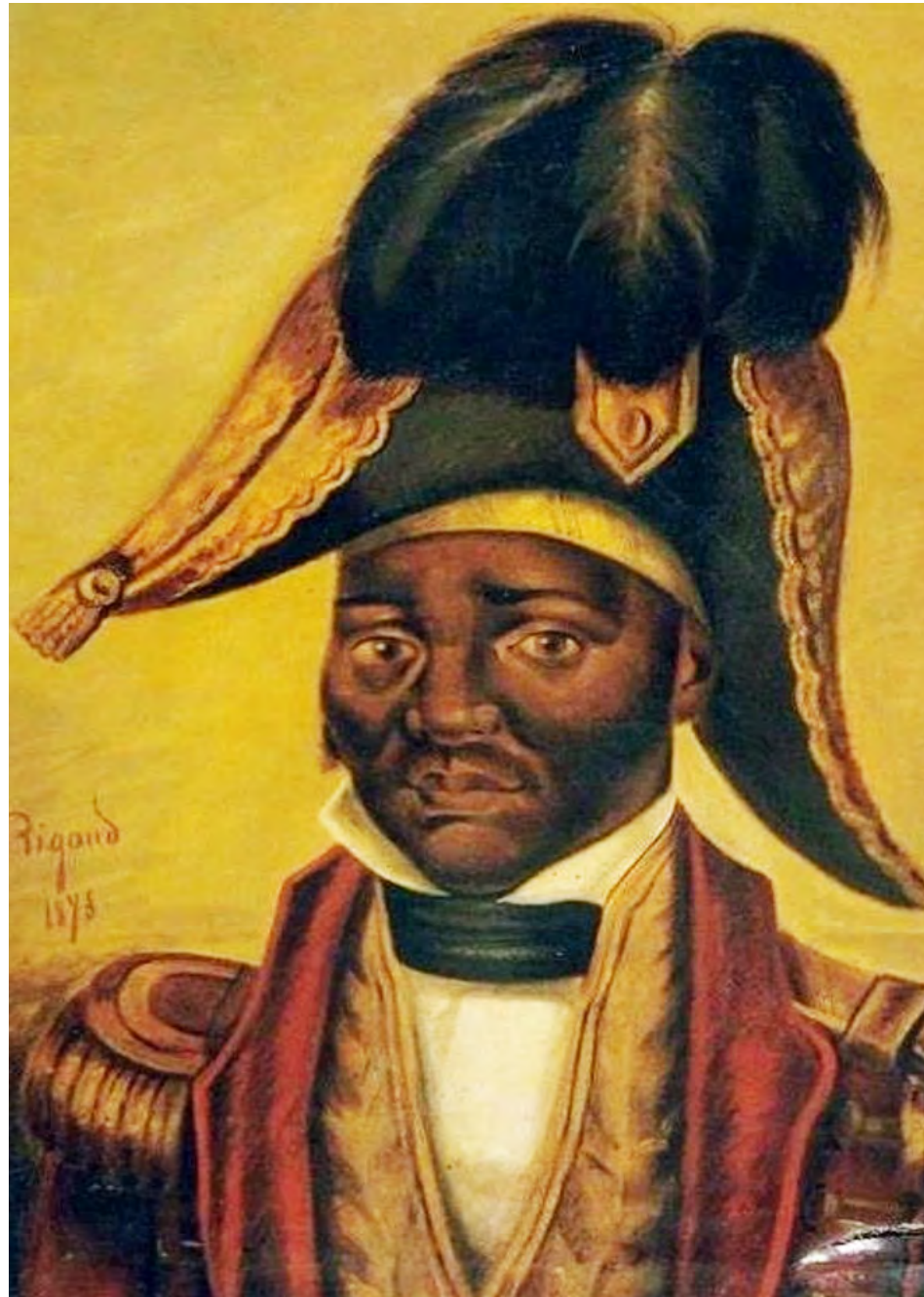
Jean Jacques Dessalines, Presidente y luego Emperador de Haití. Autor: Louis Rigaud. 1878. Institute of the Black World 21st Century.

Miranda no va a poner nunca en cuestión el principio de igualdad y, de