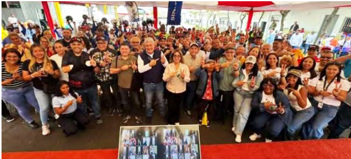
Autoridades venezolanas agradecieron las muestras de solidaridad

Un encuentro virtual celebraron ayer los trabajadores organizados de todo el mundo, actividad en la cual expresaron su respaldo al pueblo venezolano, exigieron respeto a la soberanía nacional y la liberación inmediata del presidente Nicolás Maduro y de la primera dama Cilia Flores.