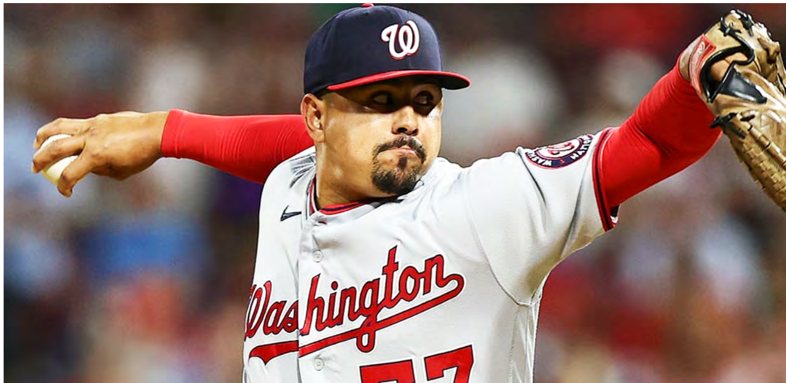
Lanzó tres temporadas con Nacionales de Washington en la LVBP

Se reportó con Búfalos de Orix en la Liga Japonesa de Beisbol