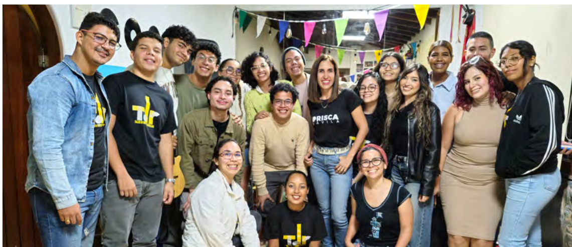
El conjunto nació en 2023 como parte del programa Mi Juguete Es Canción