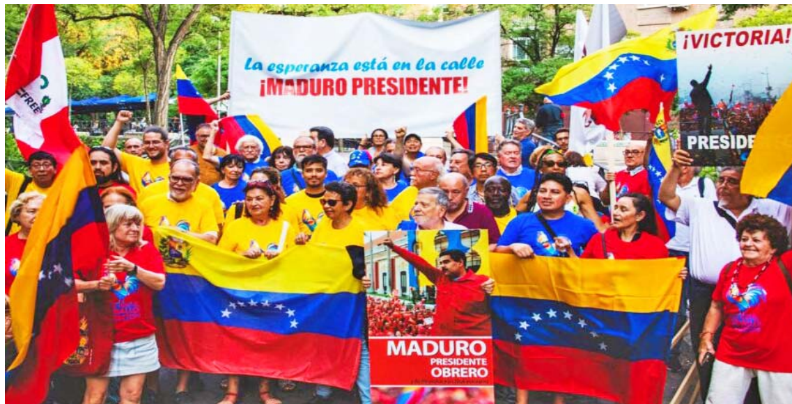
Durante la nutrida marcha los manifestantes expresaron su respaldo al pueblo venezolano

Una manifestación de respaldo entusiasta y militante al presidente Nicolás Maduro y al pueblo venezolano se llevó a cabo en el Centro Social Pasillo Verde Ferroviario, en Madrid, donde se dieron cita las fuerzas que integran