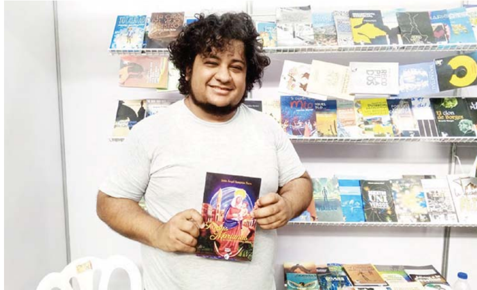
El editor es egresado de la carrera de Letras en la LUZ

Esta insistencia en continuar la edición en papel, también responde a las preferencias mucha gente que aún siente placer en ojear, sentir e incluso oler al libro “para poder sentirlo físicamente, porque leen por computadora o leen por redes sociales. Para las nuevas generaciones eso ya no es un problema, pero tenemos que