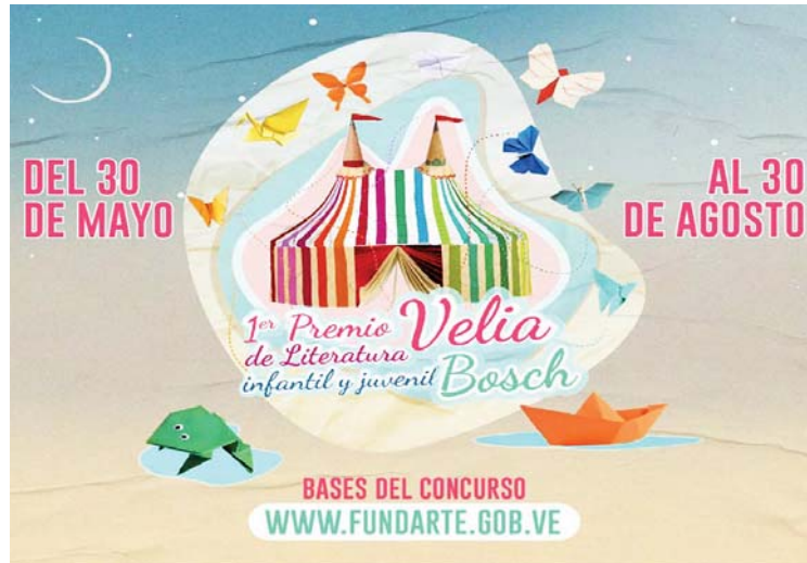
Usualmente los ganadores se anuncian en la Feria del Libro de Caracas

Además, en esta edición del concurso, se permitirá la participación de ganadores anteriores en categorías distintas, fomentando así la diversidad y