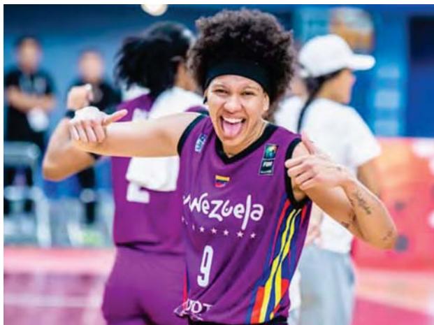
Las muchachas presionaron de principio a fin

Este martes la Vinotinto femenina va contra Malí, desde las 10:30 pm (hora Venezuela); y el jueves con República Checa a las 4:30 pm. Las dirigidas por el argentino Eduardo Pinto libraron una gran batalla ante unas rivales que en el papel se veían inmensas, pues ocupan el puesto trece del ranking FIBA y además buscan ir a su mundial 16, mientras las criollas pelean por llegar apenas al primero.