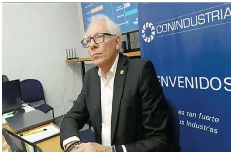
El presidente de Conindustria, Luigi Pisella

La Encuesta de Coyuntura Industrial del gremio arrojó que los sectores industriales que mostraron buen desempeño durante este trimestre fueron madera y papel (67,2 %), plástico y caucho (41,8 %), farmacéutico (38 %), bebidas (29,3 %) y alimentos (19 %)