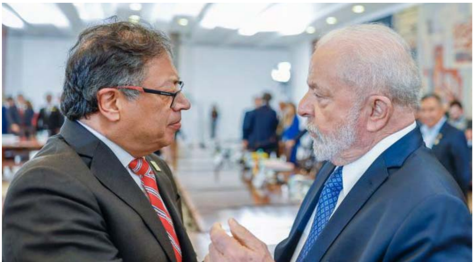
Brasil y Colombia sugieren nuevas elecciones en Venezuela, en un contexto de presiones

El canciller colombiano, Luis Gilberto Murillo, informó a través de su cuenta de X sobre su conversación con el Secretario de Estado de EEUU, Antony Blinken, el 12 de agosto.