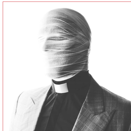
El tema está disponible en plataformas digitales

El moombahton es un subgénero de la electrónica que consiste en fusionar el house con el reggaetón; en este sentido el DJ caraqueño se atreve a afirmar que Apocalypticka es "el moombah más pesado hecho en Venezuela" y desafía a cualquiera a encontrar un tema de ese estilo con características similares o más pesado producido en el país: