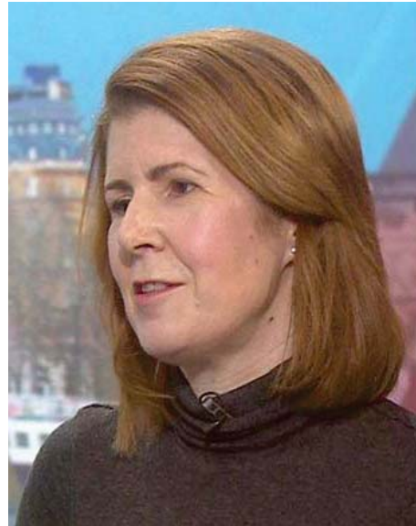
La ministra británica para América Latina y el Caribe, Jenny Chapman.

En su texto, Chapman aseguró que “sin pruebas detalladas, el resultado