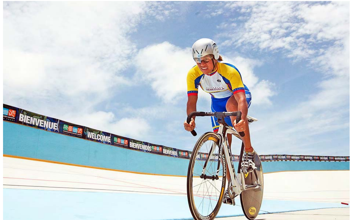
Hasta los 39 años se mantuvo activa como ciclista de pista

En los Panamericanos de Santo Domingo 2003, logró dos platas: en keirin y velocidad, ambas pruebas ganadas por la estadounidense Tanya Lindenmuth. Sin embargo, no pudo participar en