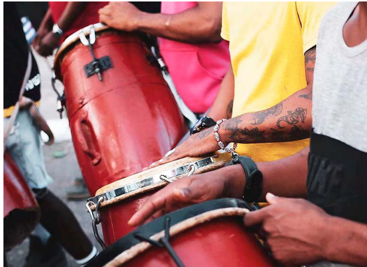
El evento propicia el encuentro de culturas

Las actividades se realizarán fundamentalmente en La Habana, con destaque en el barrio de Pogolotti, donde la rumba, ritmos y sonoridades de herencia africana están bien presentes