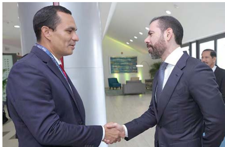
El ministro Luis Villegas encabezó la delegación venezolana

Ortega destacó la importancia estratégica de las relaciones entre China y la región latinoamericana, instando al desarrollo regional en diferentes ámbitos.