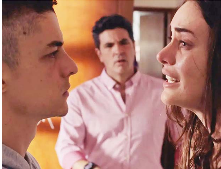
El largometraje ya estopa en los circuitos comerciales del país

De manera que en este caso, a diferencia de otras propuestas en las que una debilidad en la interpretación se puede compensar con otros elementos, las actuaciones soportan la mayor parte del peso, como columnas antisísmicas que se fundamentaron muy bien en el equipo