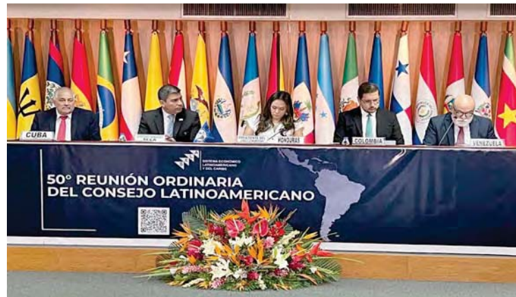
En el Área de Recuperación Económica se aprobaron 25 actividades

En el Área de Recuperación Económica, se aprobaron 25 actividades relacionadas con la Integración Económica, la Facilitación del Comercio y el apoyo a las pequeñas y medianas empresas (Pymes); en el Área de Digitalización e Infraestructura, se definieron 9 actividades para la Transformación Digital y la Infraestructura Energética Sustentable; mientras que en el Área de Desarrollo Social