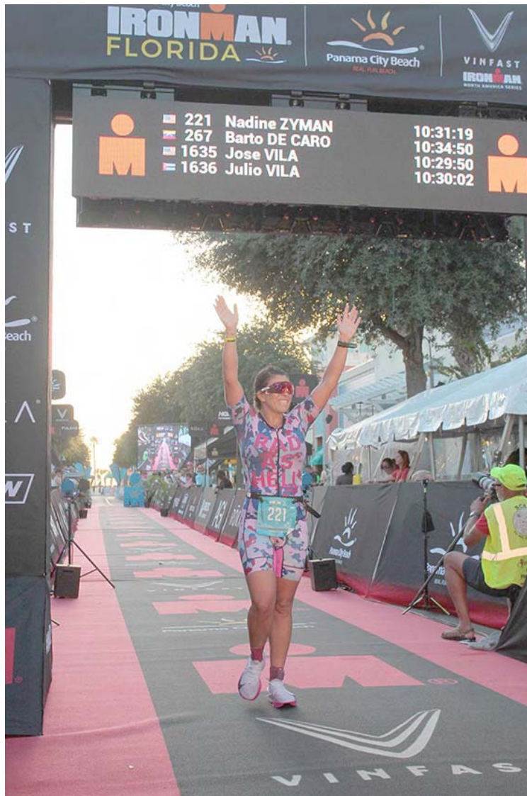
Sus dos niños son la inspiración para competir con más ánimo