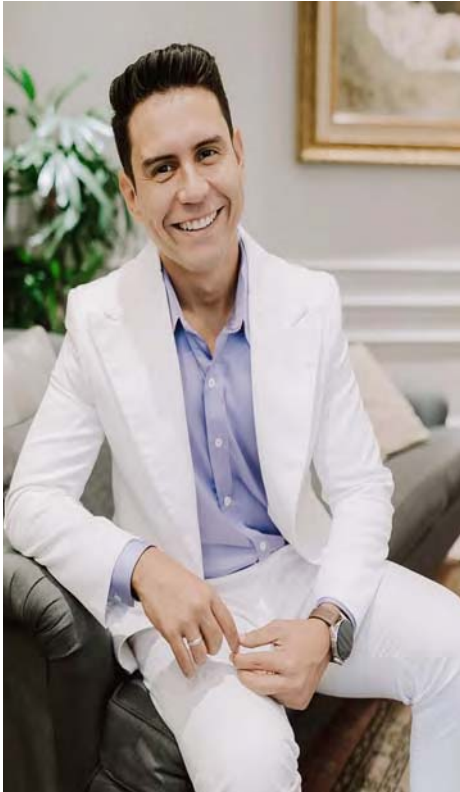
Interpretará algunos temas en la lengua del el pueblo pemón

El salsero además aparece en una de las escenas del seriado televisivo que combina drama y comedia