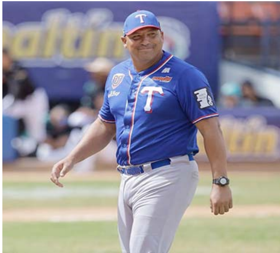
El orgullo de Puerto Cabello es un hombre más espiritual hoy en día.