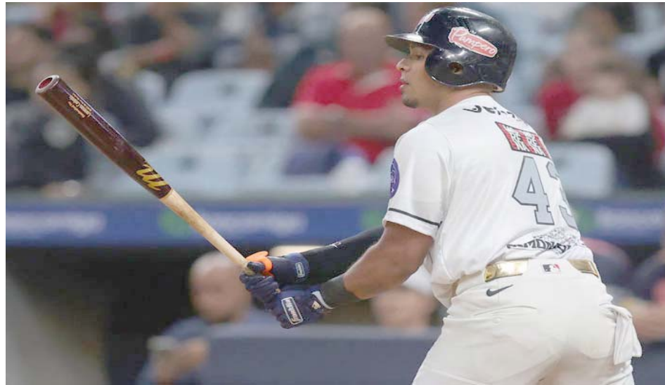
El infielder apenas tiene 26 años, por lo que le queda bastante combustible