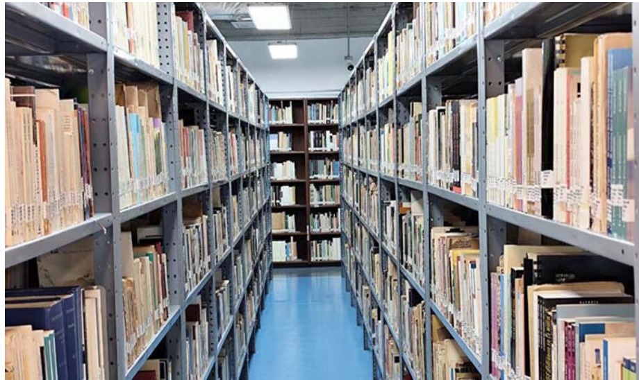
En esta oportunidad el concurso admite trabajos publicados en formato digital

T/ Redacción CO