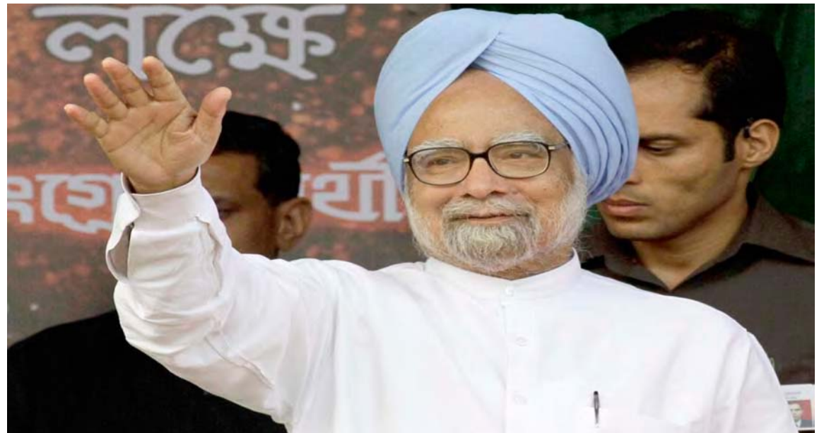
“Manmohan Singh dejó un legado indeleble como un líder visionario”

Sobre los asuntos internacionales, ambas autoridades ratificaron la condena a la injerencia extranjera en los asuntos internos, en el respeto a la soberanía y el derecho internacional, así como hacia el rechazo absoluto a las Medidas Coercitivas Unilaterales.