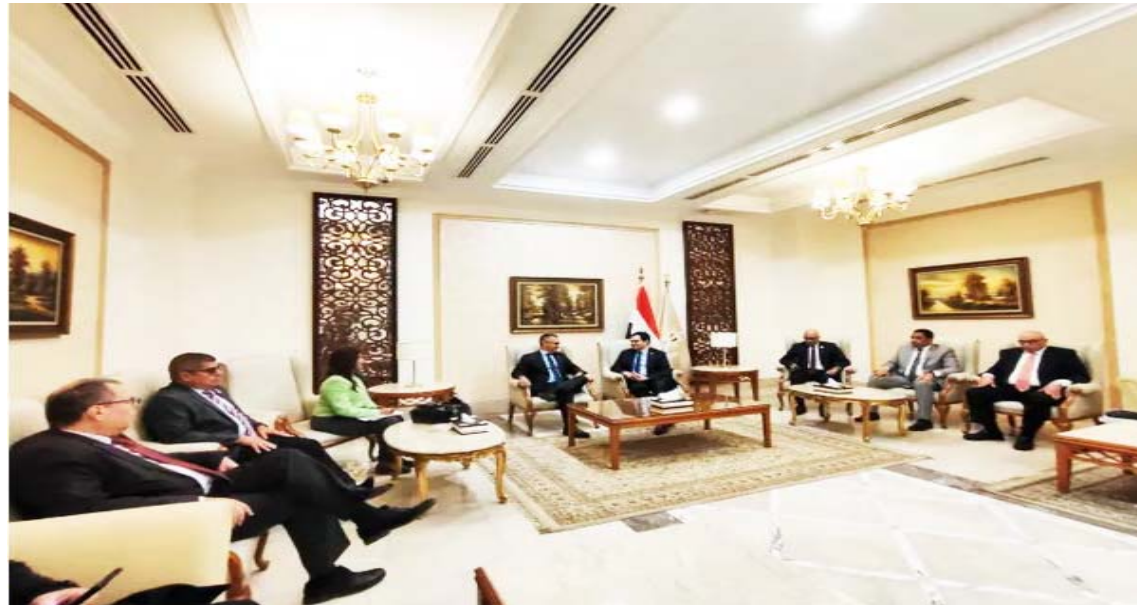
“Venezuela y Egipto tienen mucho por dar al equilibrio del mundo”, expresó el ministro venezolano para la Cultura, Ernesto Villegas

Redacción CO-Prensa Cenal