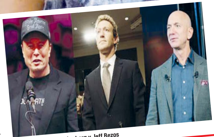
Elon Musk, Mark Zuckerberg y Jeff Bezos

Queda por analizar lo que está sucediendo en nuestro país con Tik Tok y todo lo que tiene que ver con los algoritmos pues su uso se están tornando en algo muy peligroso.