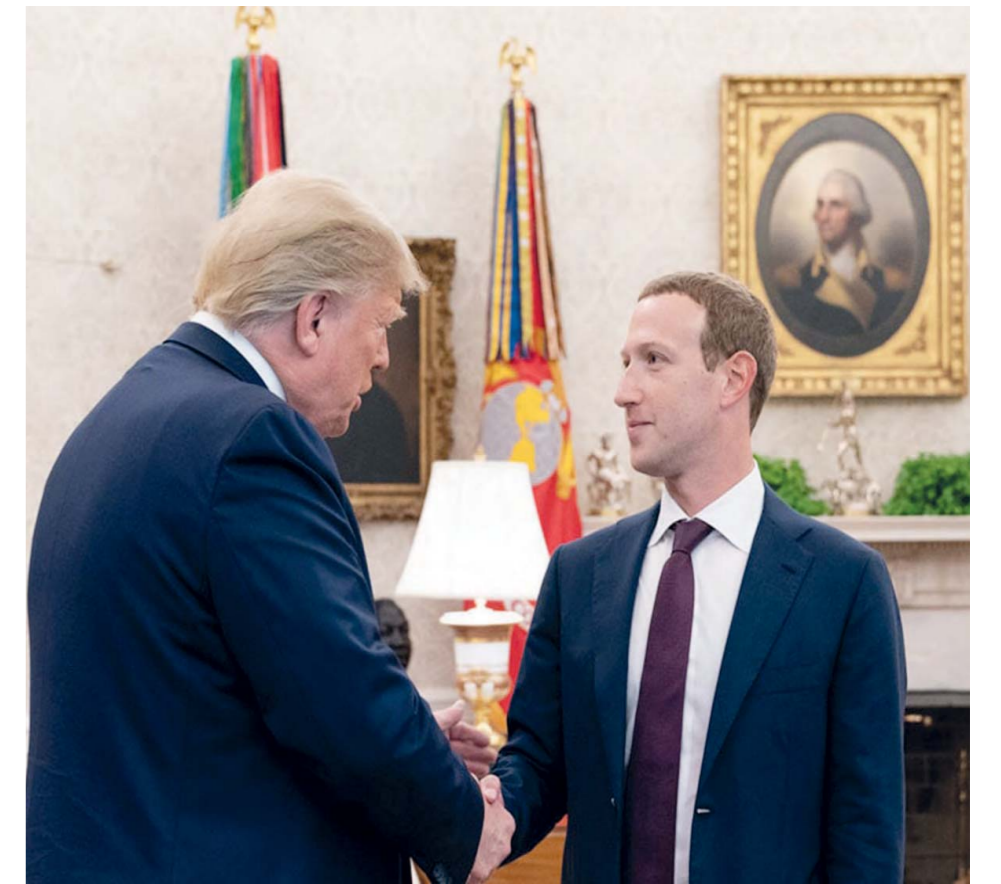
Donald Trump con el CEO de Facebook, Instagram y Whatsapp, Mark Zuckerberg

afirmar que limitar su prepotencia recorta sus derechos. Lo cual, según cómo se mire, es cierto. Esa es precisamente la función de los derechos conquistados: establecer reglas para que tu libertad no elimine la libertad de los demás. Es decir, que quienes tienen el poder de expresarse con todos los medios a su disposición –ya sea un presidente, un multimillonario o el hombre más rico del mundo– no puedan silenciar otras opiniones con menos altavoces.