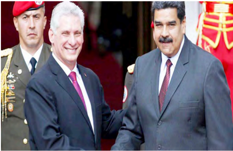
“Toda la solidaridad y el apoyo de Cuba a la Revolución Bolivariana y Chavista, liderada por el presidente Maduro”, expresó Díaz-Canel

“Toda la solidaridad y el apoyo de Cuba a la Revolución Bolivariana y Chavista, a por el presidente Nicolás Maduro. La fortaleza de la Unión Cívico-Militar en Venezuela derrotará las amenazas imperialistas y los actuales intentos de sabotear el desarrollo del país”. Las declaraciones se produjeron tras las recientes amenazas de Estados Unidos (EE.UU.) contra el líder de la Revolución Bolivariana que, de acuerdo con varios gobernantes latinoamericanos, entre ellos Gustavo Petro y Daniel Ortega, representa también una agresión para la región. Un despliegue de 15.000 funcionarios entre los estados de Táchira y Zulia (oeste), fronteras con Colombia, anunció el ministro para Relaciones, Justicia y Paz, Diosdado Cabello, con