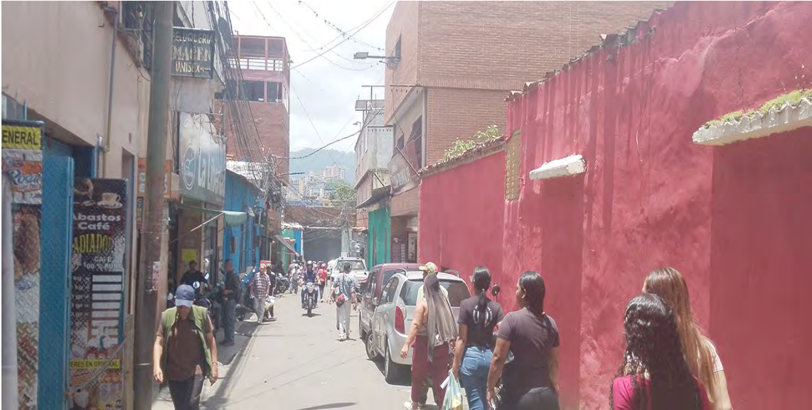
En la calle Libertad hicieron algunas mejoras

“Cuando el presidente Nicolás Maduro”, dice, “asumió que Petare necesitaba un plan especial para acometer los problemas de servicios, de vialidad, de seguridad, pero también rescatar aspectos icónicos para la población, y designó a Pedro Infante al frente del Plan Sucre se han