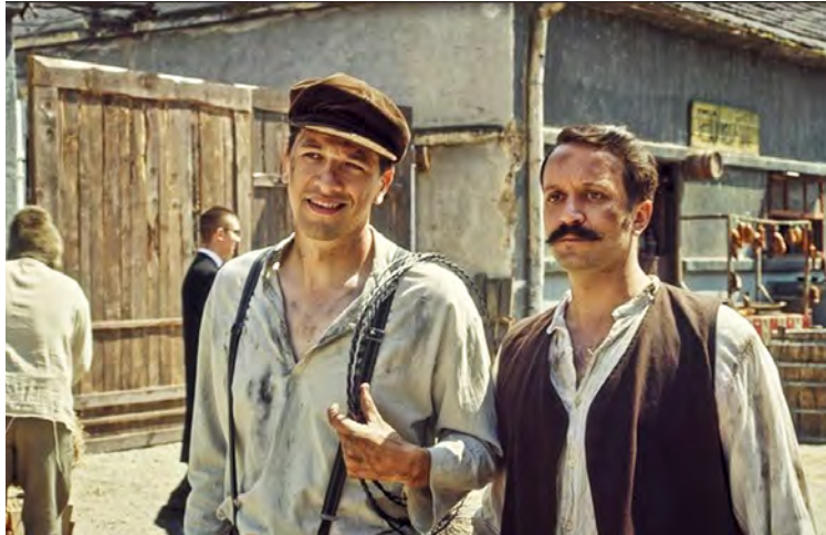
Érase una vez Serbia , es uno de los títulos programados

El segundo sábado se proyectará El duque y el poeta (2023) de