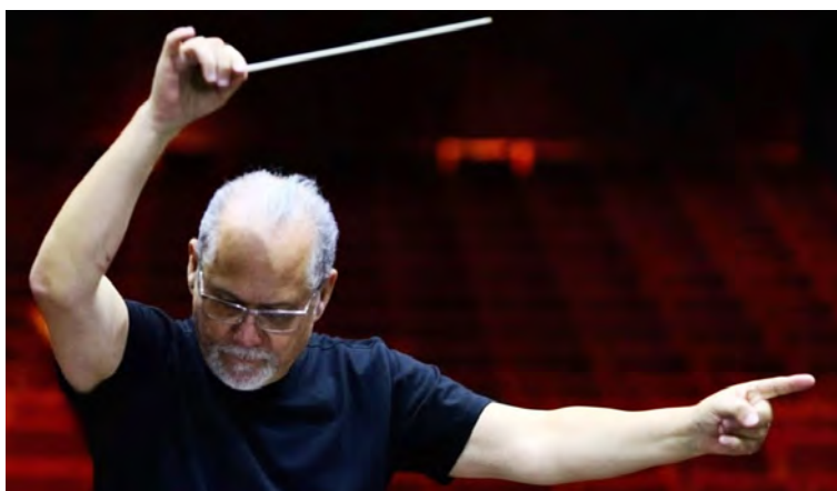
El venezolano es muy valorado como arreglista a escala mundial