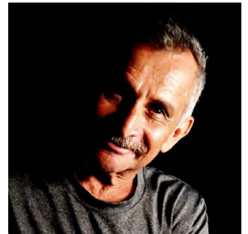
Una de sus interpretaciones más recordadas fue en Prueba de fuego .

Como miembro fundador y productor general del Comité Organizador del Festival Internacional de Teatro de Oriente, Silva dedicó cuatro décadas ininterrumpidas a consolidar este evento que se