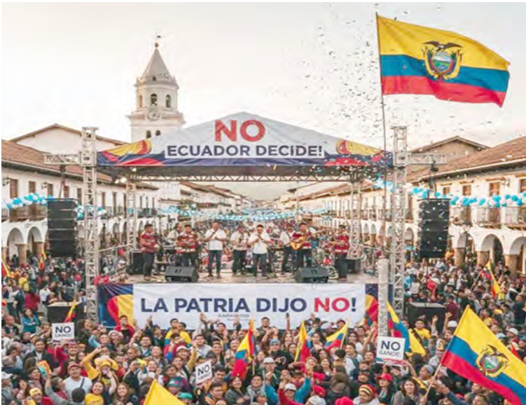
“El pueblo de Ecuador ha dado una demostración de grandeza”, dijo el canciller Yván Gil

“Desde la tierra de Simón Bolívar enviamos un abrazo profundo y felicitamos al pueblo ecuatoriano, heredero de la gran patriota y revolucionaria Manuelita Sáenz y del general Eloy Alfaro”, afirmó el ministro