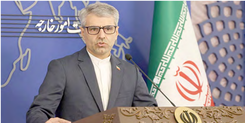
“Lo hecho por las fuerzas de EE.UU. constituyen un claro delito”, advirtió el portavoz iraní

“En nombre del presidente Maduro, extendemos un saludo Bolivariano a Irán y expresamos nuestro agradecimiento por su firme rechazo al asalto perpetrado por el Ejército de Estados Unidos contra un buque mercante cargado de petróleo venezolano, bajo órdenes de la actual ad-