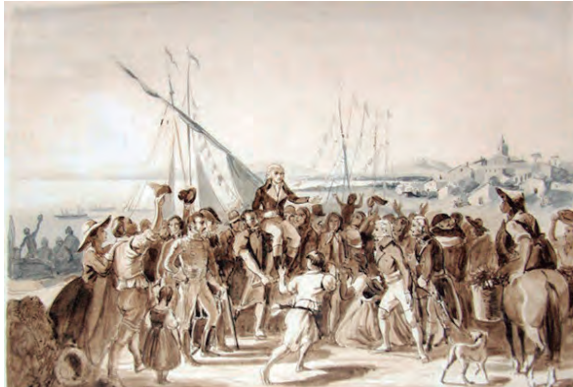
Johann Moritz Rugendas. Regreso de Miranda a Venezuela en 1810. Sepia original, 25,2 x 33,1 cm. Fundación John Boulton, Caracas

Entre los buques extranjeros entrados en estos días en el Puerto de la Guayra, lo han hecho los bergantines de S. M. B. Florester y Avon; en este último ha venido nuestro compatriota D. Francisco de Miranda, y ha sido recibido como merece un ciudadano de Venezuela a quien las distinciones y honras que la Europa imparcial ha tributado a su mérito no han podido hacer olvidar su patria, por cuya felicidad ha hecho esfuerzos muy repetidos y eficaces. Tan relevantes circunstancias, de que Caracas no podría prescindir sin ser inconsecuente en sus principios, unidas a las altas recomendaciones de nuestros Diputados en Londres, han hecho que el Gobierno y el pueblo de esta Capital, procuren hacer olvidar a este ciudadano los sinsabores que ha sufrido por acelerar la época feliz de nuestra regeneración política.