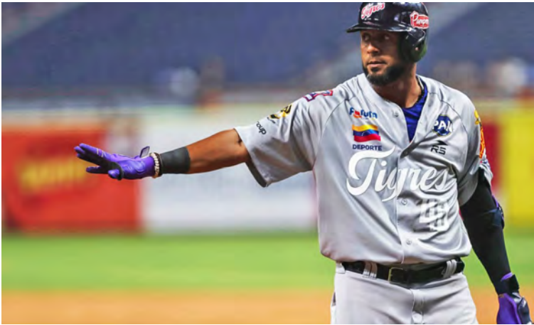
“Cafecito” superó históricamente a su padre “Café” en las Grandes Ligas

“No es fácil reconocer que el camino está llegando a su fin”, escribió “Cafecito”. “Pero sí es un honor para mí mirar hacia atrás y sentir orgullo por cada paso que di, por cada liga donde jugué, y por cada batalla