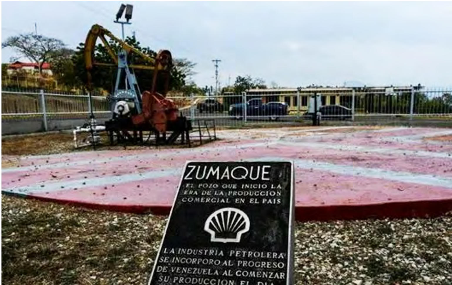
Placa conmemorativa de Pozo Zumaque I, en Mene Grande, estado Zulia, Venezuela

Durante todo el siglo XX la economía nacional estuvo atada a decisiones de capitales extranjeros