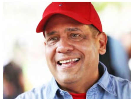
Gobernador Neil Villamizar

El proceso se efectuó bajo las facultades del Poder Legislativo establecidas en la Ley Orgánica de los Consejos Legislativos de los Estados, que faculta a los diputados a discutir y aprobar los presupuestos de sus entidades.