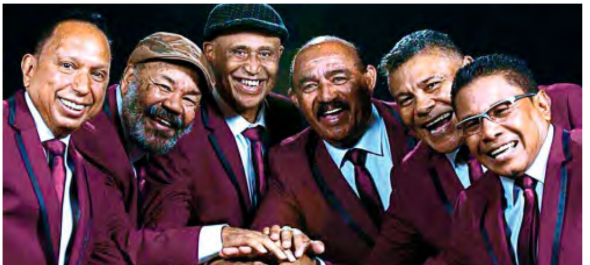
El tema fue compuesto hace dos años por César “Albóndiga” Monges

El videoclip oficial de la canción se grabó en Caracas, en los estudios La Bóveda Studios y Pedrosa Films. La producción recreó la ambientación de un barrio caraqueño e involucró a cuerpos de baile, músicos y compositores. Un hecho destacado del rodaje fue