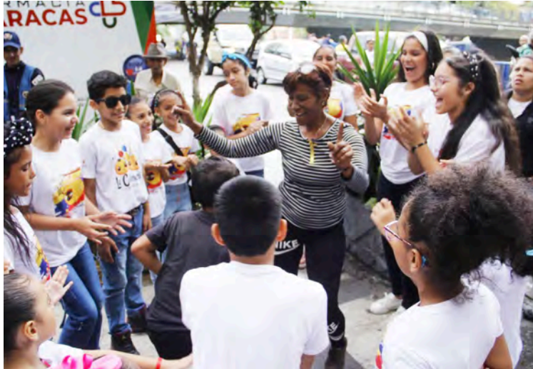
La iniciativa también promovió propuestas teatrales y dancísticas

Como parte del apoyo al talento venezolano beneficiado con esta iniciativa, la plataforma entregó un material de promoción estimado en más de 500 demos