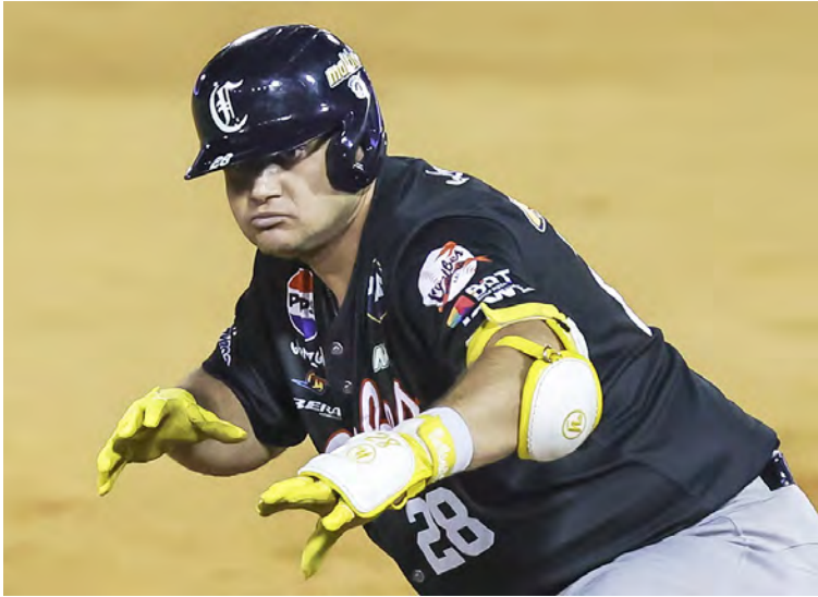
“Balbineitor” pegó 17 vuelacercas en este torneo

de .330/.394/.617, contribuyendo a la primera clasificación de Caribes a la postemporada desde la zafra 2022-2023. “Representa mucho para mí este premio, porque en las últimas tres temporadas nos íbamos tristes a la casa por la eliminación. Este año, desde la pretemporada, nos propusimos tener más compromiso, llegamos temprano a prepararnos y estoy en gratitud con Dios, porque lo más bonito es que este premio se da en la clasificación de Caribes al Round Robin para la alegría de nuestra fanática”, contó Fuenmayor. El toletero recibió 29 votos al primer lugar, 10 al segundo y seis al tercero para obtener su segundo Premio Víctor Davalillo al Jugador Más Valioso, después del conseguido en la campaña 2021-2022, cuando se unió a Magglio Ordóñez (1996-1997)