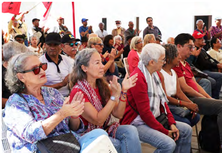
En actividad se condenó el rapto de la pareja presidencial