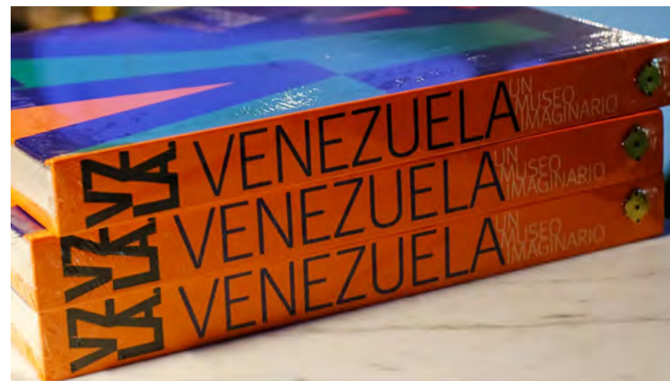
Un total de 50 artistas están incluidos en esta propuesta

El diseño gráfico estuvo a cargo de Pedro Quintero y la asesoría editorial de Fabiana Abreu. Como un extra, el libro incorpora tecnología digital mediante códigos QR que enlazan