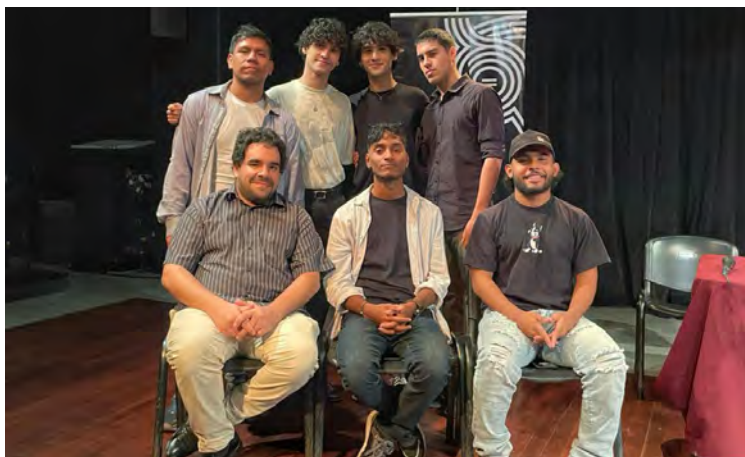
El evento es una plataforma para el talento y para la dramaturgia nacional

El orden de presentación, definido por sorteo en octubre pasado, revela un marcado acento en la dramaturgia venezolana. Cuatro de las seis obras programadas son de autores na-