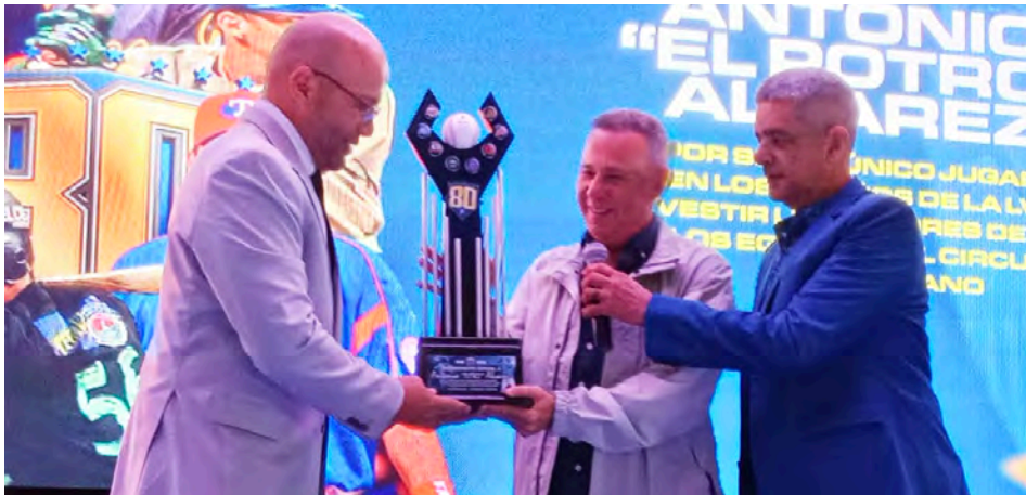
Muy orgulloso del reconocimiento que le dio Numeritos Gerencia Deportiva

Sin embargo, le vuelve a tocar su segundo chan-