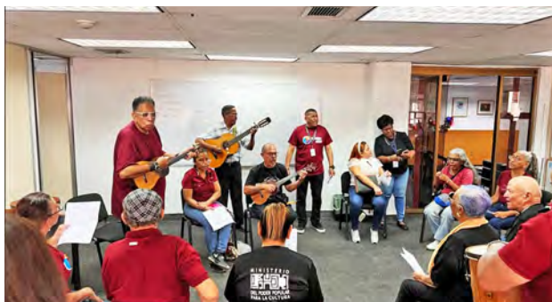
Trabajadores del MPPC se involucraron en la actividad

La tradición, proveniente de los andes venezolanos, representa el fin de las celebraciones navideñas y coincide con el Día de la Candelaria y ofrece la oportunidad de realizar peticiones por la paz, la salud, la familia y la liberación del presiden-