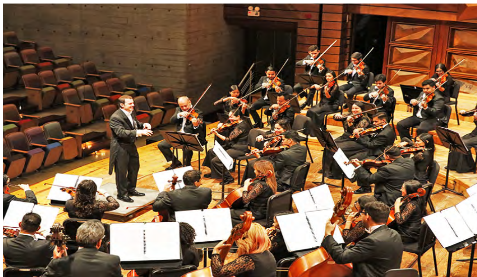
La primera etapa de la fiesta se extenderá hasta finales de febrero

Este viaje sonoro comienza el viernes 6 de febrero a las 4:00 p.m., con la Orques-